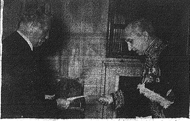
Ο νέος πρεσβευτής της Ελλάδος κ. Φίλιππος Παπαδόπουλος και ο προερχόμενος πρεσβευτής κ. Γεώργιος Παπαδόπουλος.