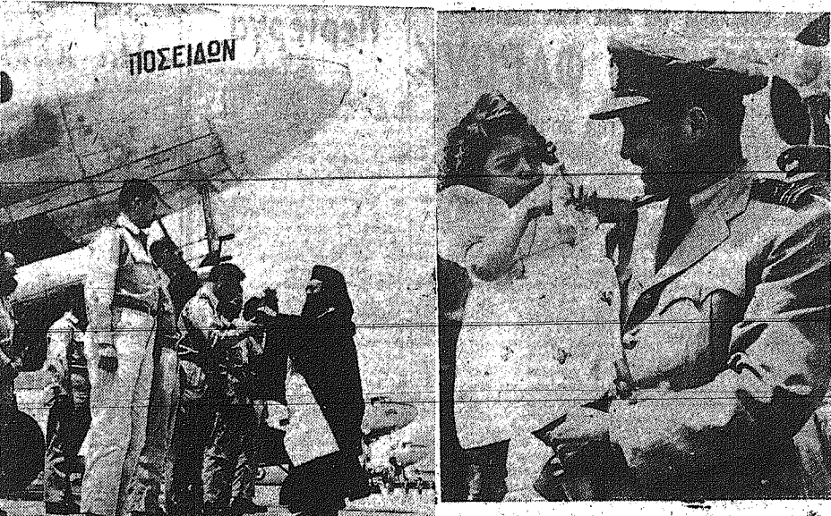
ΑΠΟ ΤΗΝ ΕΠΙΣΤΡΟΦΗΝ ΤΩΝ ΕΛΛΗΝΩΝ ΑΕΡΟΠΟΡΩΝ ΕΚ ΚΟΡΕΑΣ