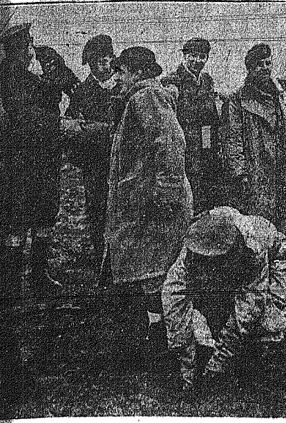
Κατά την διάρκεια της περιόδου του ελίου πληγείας ο Υπουργός βυθίζεται στην λάσπη...