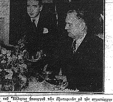
Από την πρόσφατη συνάντηση του Έλληνα Υπουργού των Εξωτερικών με τον σταυροίτη Τίτο εις την νήσον της Δαλιματίας...