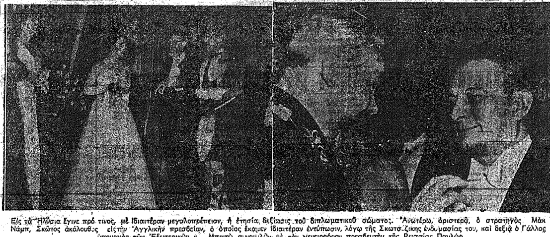
Είς τήν Ηρώσει έγινε πρό τιμος, με ιδιαίτερον μεγαλοπρεπείαν, η έθνησις βελτισία του διπλωματικού σώματος...