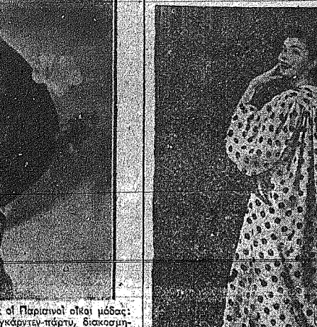
Το ζαρωμένο σιρό καλοκαιρινό νυκτικό είναι κεραιμένο από...