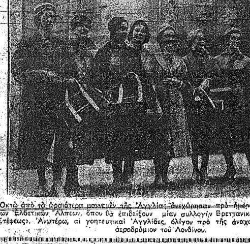
Όκτώ από τα όμορφωτα μοναχικά της Άγγλικής νεογέννητο-προ-ημερών δια Σαιντ Μόρις της Ελβετίας Άλπεων, όπου θα επιδείξουν μίαν συλλογήν Βρετανικών φορεμάτων της Στέρας. Άνωτέρω, οι γοητευτική Άγγλίδες, όλην προ της άναρχορσού, των από το περιβόλου του Λονδίνου.