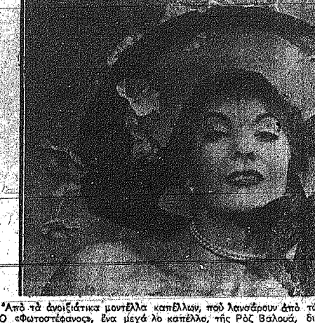
Από τα άρπάζματα μοντέλα καπέλων, που ληστεύουν από τον Κόσμο...