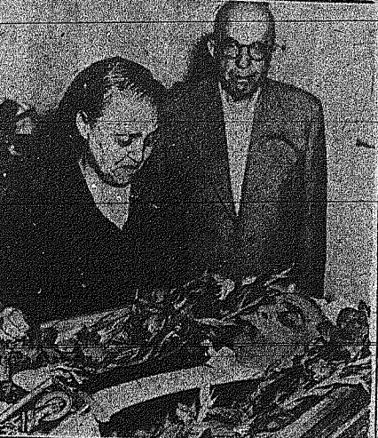
Ο θάνατος πρίην πρωθυπουργού, αντιπρ. Νικόλαος Πλαστράς...