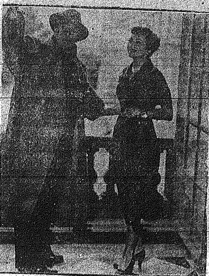
Το άνω αριστερό... Η άνω δεξιά... Η κάτω δεξιά...