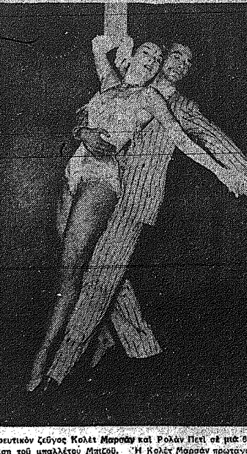
Το χορευτικό ζεύγος Κολέτ Μαρσάν και Ρολάν Πετι σε μια θαυμάσια εμφάνιση του μπαλέτου Μαρσάν. Η Κολέτ Μαρσάν πρωταγωνίστησε με επιτυχία στην ταινία «Κουλέν Ρόζ».