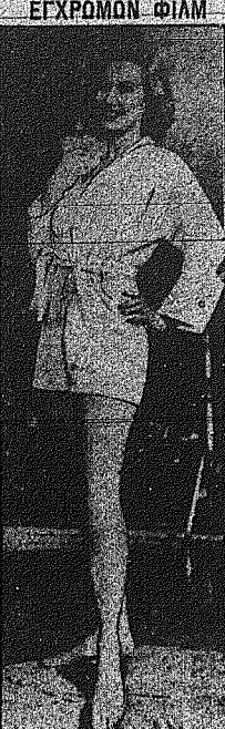
Η Βιρελίνα Μάγιο, λίγο πριν από το πρώτο της μήνα στην πολυτελή κερπήνη της επιπέδου της «Βιρελίνα Μάγιο» είναι η ηθοποιός που έχει πρωταγωνιστήσει στα περισσότερα εγχρώμα φιλμ.