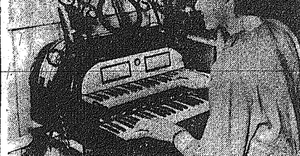
Ένα νέο μουσικό όργανο... είναι η Γερμανία, οι οποίοι γλεντούν το Καρναβάλι, στη Γερμανία, άνοιξαν...