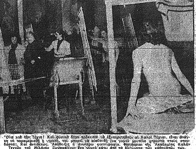
Όλα γὰρ τὴν τέχνην καὶ οὐκ ἄλλοι δύνανται ἀνεκτιμηθῆναι...