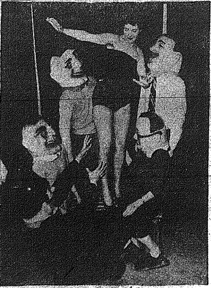
Δεν είναι μία φωτογραφία οποιαδήποτε... είναι η Γερμανία, οι οποίοι γλεντούν το Καρναβάλι, στη Γερμανία, άνοιξαν...