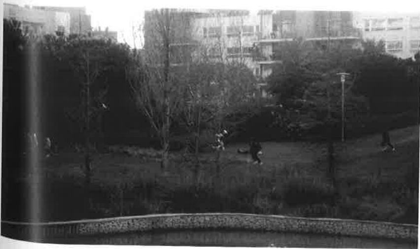
Εικόνα 6. Ελευθερία κινήσεων στον παιχνιδότοπο, Βαρκελώνη – Diagonal Mar park