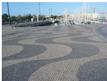
Εικόνα 7: Πλακόστρωτο από κυβόλιθο με γρανιτικά σέτ και δημιουργία σχημάτων