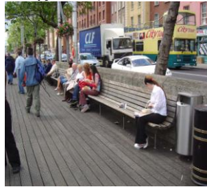
Εικόνα 4: Ξυλινη πλακόστρωση