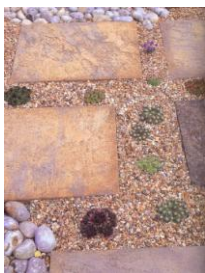
Εικόνα 6: Συνδυασμός χαλικιών με πέτρα και φύτευση

διαστάσεις και μετά βοτσαλοποιούνται σε μεγάλες περιστρεφόμενες βαρέλες μέχρι να επιτευχθεί το επιθυμητό “στρογγύλεμα”. Ακολουθεί ο τελικός διαχωρισμός ανάλογα με την διάσταση. Βότσαλα χρησιμοποιούνται για διακόσμηση κήπων, εδαφοκαλύψεις, βοτσαλωτά δάπεδα. Εξωτερικοί χώροι χωρίς αυτοκίνηση μπορούν να αλλάξουν κυριολεκτικά πρόσωπο, αλλά και την αισθητική όλου του χώρου, καλυπτόμενοι με βότσαλα-ψηφίδες (βλ. εικ. 5,6) .