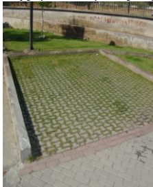
Εικόνα 3: Ενισχυμένο Γρασίδι

Άμμος: Η άμμος είναι ιδανική για παιδότοπους, παρουσιάζει λεπτή υφή, ικανοποιητική αποστράγγιση, αλλά κατά καιρούς απαιτείται αντικατάσταση της για λόγους υγιεινής.