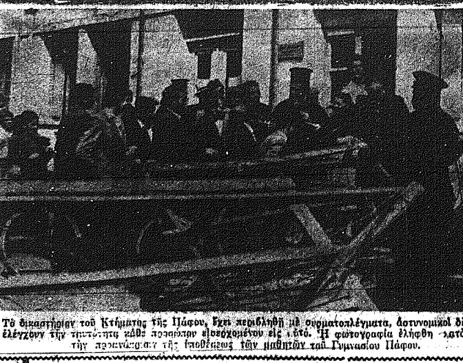
Το διασημότερο του Κρήθμιον της Πάφου, έχει περιβληθεί με ορειανολόγημα, αστυνομική δε έλεγχον την περιπόνηση καθε προσώπου ερευνώντος επί ατό...