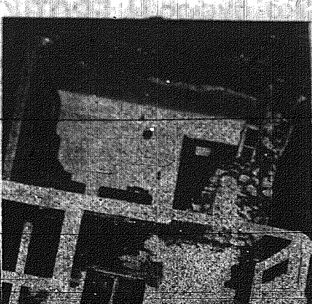
1. Η πρώτη προκατάκτη λειτουργία, μετά τους σεισμούς, εις τὰ Ἄνω Δεκάγια, ἔγινεν εἰς τὸ ἑκπαιθεύον. Οἱ σεισμοπαθεῖς συγκεντρώνονται γύρω ἀπὸ τὸν ἱερέα τῶν καὶ παρακολουθοῦν μετὰ τὴν ἱερολεξιάν.