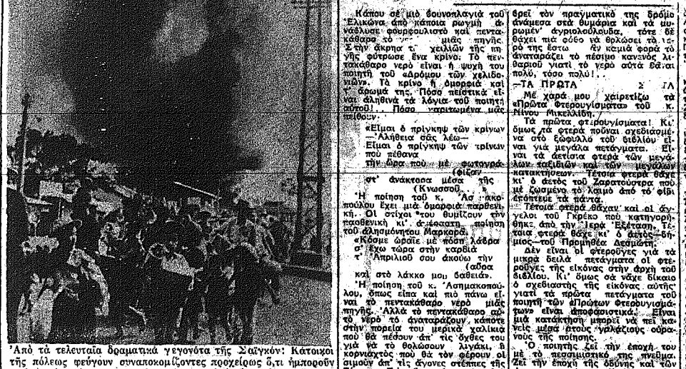
Από τα τελευταία δραματικά γεγονότα της Σαγγαίνης. Καταγραφή της πόλεως φέρουν συνολικόν αριθμό 500.000 ανδρών, 1.000.000 γυναικών και 1.500.000 παιδιά.