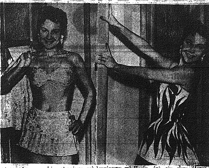
Λύο κατόρθωσι κατόρθωσι το μάτι...