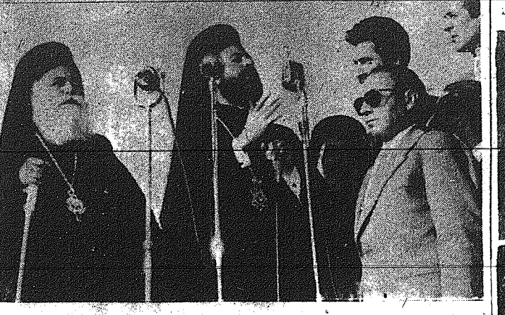
Ο Έδναρχος Κύπρου Μακάριος δηλώνει εις Θεολογικήν κατά την μεγάλην λαϊκήν συγκένωσιν Παιδ' από τον Μ. Πολίτη Θεσσαλονίκης.

ΑΝΘΙΣΜΕΝΑ ΝΕΙΑΤΑ ΠΑΝΕΓΧΡΩΜΑ ΝΤΟΝΑΛΤ ΟΚΟΝΝΟΡ - ΤΖΑΝΕΤ ΛΗ Στον Κινηματογράφον