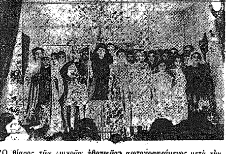
Ο θίσιος των μικρών ηθοποιών φωτογραφούμενος μετά την παράστασιν.

ΟΙ ΜΑΘΗΤΑΙ ΤΗΣ ΠΑΛΛΟΥΡΓΙΤΙΣΣΗΣ ΑΝΑΘΙΒΑΖΟΥΝ ΤΗΝ 'ΑΝΤΙΓΟΝΗΝ' ΤΟΥ ΣΩΦΟΚΛΕΟΥΣ ΚΑΤΑ ΔΙΔΑΣΚΕΥΗΝ ΔΙΑ ΠΑΙΔΙΑ