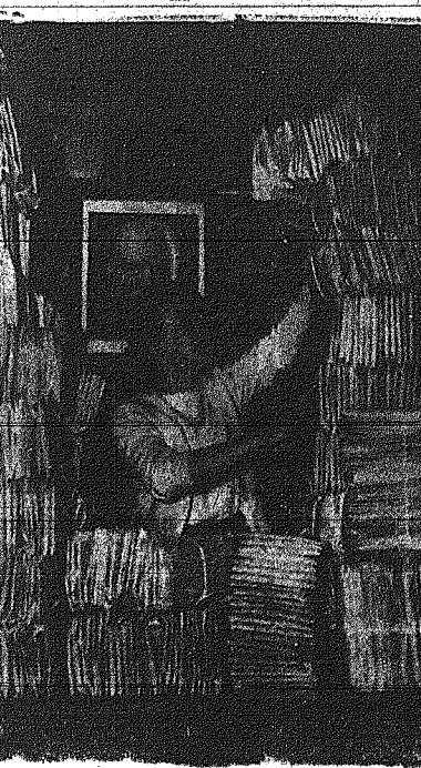
Το αγγλικό ταχυδρομείο γνωρίζει τις ήμερες αυτές προσιτά... Ημερομηνία...

Θα ξεπουληθούν 3000 ζεύγη Γυναικείων και Άνδρικών Υποδημάτων εις τιμές από 7 - και άνω.