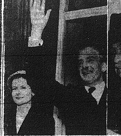
Ο γηραιός και ο ήττημένος των ελλογιών της 'Αγγλίας. Άοιστος ο Δ. Προβιδοπουλός...