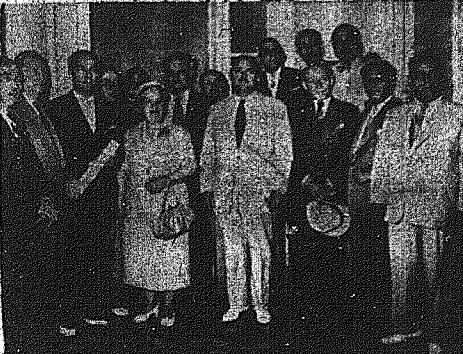
ΑΙ εθνικαί οργανώσεις ανεκήρυξαν τον Προσηλυτισμόν...