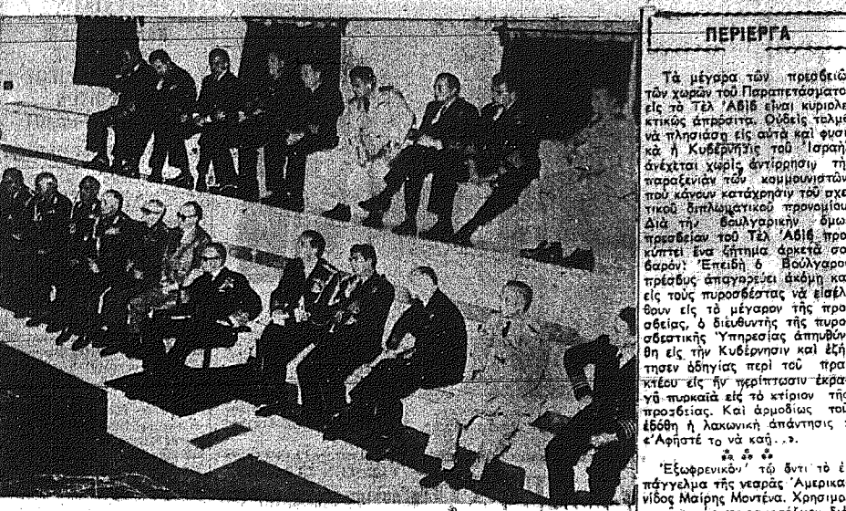
Από την κοίτη του τελικού πολεμικού παιχνιδιού εις την Έλληνική Ναυτική 'Ακαδημία...