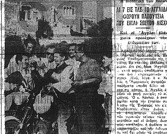
Χορω ήλληνικών ούλλεγει κάτω από τήν Άρσολήν και τήν Κάβη μέση οι ένα φαμελλία ο... ομήτης πλανήτης...