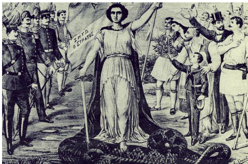
Γκραβούρα εποχής για την αναγέννηση που έφερε το κίνημα του 1909 στη χώρα.

λειτουργούσε αποσταθεροποιητικά στη λειτουργία του πολιτικού συστήματος. Η τάση αυτή ενισχυόταν ως αποτέλεσμα της διάχυτης αμφιβολίας της κοινής γνώμης σχετικά με την αποδοτικότητα των υφιστάμενων πολιτικών κομμάτων συνολικά. Κάτω από αυτές τις συνθήκες, η διάδοση απόψεων που δεν στρέφονταν εναντίον αποκλειστικά του ενός ή του άλλου κομματικού σχηματισμού, αλλά αμφισβητούσαν ανοιχτά το ίδιο το κοινοβουλευτικό πολίτευμα (ή –σε πιο ακραίες περιπτώσεις– ακόμα και την ιδέα του συνταγματικού κράτους) έβρισκαν πρόσφορο έδαφος, υπογραμμίζοντας έτσι περαιτέρω το αδιέξοδο στο οποίο είχε σταδιακά περιέλθει η ελληνική πολιτική ζωή. Η ουσιαστική χρεοκοπία των «παλαιών» κομ-