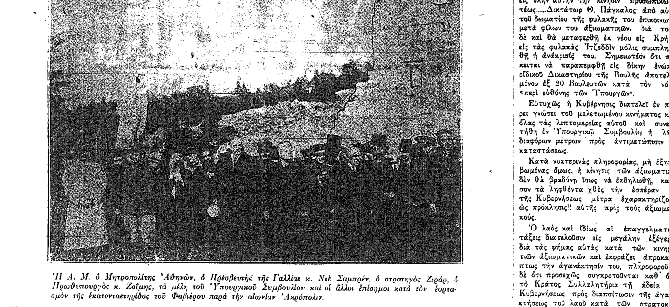
Ἡ Α. Μ. ὁ Μητροπολίτης Ἀθηνῶν, ὁ Πρεσβυτὴρ τῆς Γαλλίας κ. Ντε Σαρμπέρ, ὁ στρατηγὸς Ζιράρ, ὁ Πρωθυπουργὸς κ. Ζαίμης, τὰ μέλη τοῦ Ἐπιτελείου Συμβουλίου καὶ οἱ ἄλλοι ἐπισημοὶ κατὰ τὸν ἔσπρον τῆς ἑκατονταετηρίας τοῦ Φαβιέρου παρὰ τὴν αἰώνιον Ἀκρόπολιν.