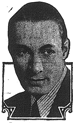
Rod La Rocque in Paramount Pictures