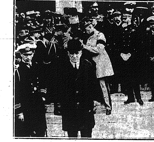
Οἱ ἐπίσημοι, ἐν οἷς καὶ ὁ Γαλλὸς ναύαρχος Νιέ Μπουέ, ἐξερχόμενοι τῆς Μητροπόλεως μετὰ τὸ μνημόσυνο.

ΑΠΟ ΤΟ ΜΝΗΜΟΣΥΝΟΝ ΤΩΝ ΠΕΣΟΝΤΩΝ ΚΑΤΑ ΤΟΥΣ ΤΕΛΕΥΤΑΙΟΥΣ ΠΟΛΕΜΟΥΣ ΑΙΣΙΟΜΑΤΙΚΩΝ ΚΑΙ ΟΠΑΙΤΩΝ