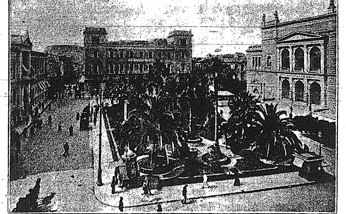
Ἡ ΠΛΑΤΕΙΑ τοῦ ΛΟΥΔΟΒΙΚΟΥ (ἐπὶ τὸν Δημ. Θέατρον καὶ τὸ Μέγαρον τῶν Ταχυδρομῶν Τηλεγραμμῶν-Τηλεφῶν).

Η ΜΕΓΑΛΗ ΕΚΔΡΟΜΗ 20 ΙΟΥΛΙΟΥ - 18 ΑΥΓΟΥΣΤΟΥ ΑΘΗΝΑΙ - ΑΤΤΙΚΗ - ΤΗΝΟΣ - ΡΟΔΟΣ Κ.Λ.Π.