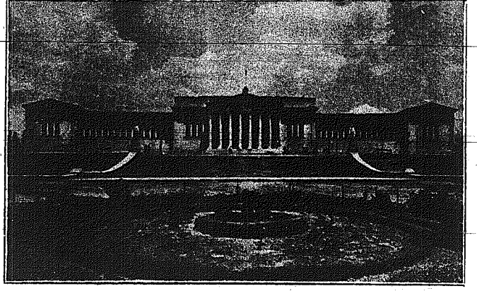
(Τὸ ΖΑΠΗΕΙΟΝ ἀπὸ τῆς ἀριστερῆς τοποθεσίας τοῦ κόσμου). ΓΥΡΩ ΑΠΟ ΤΑΣ ΑΘΗΝΑΣ