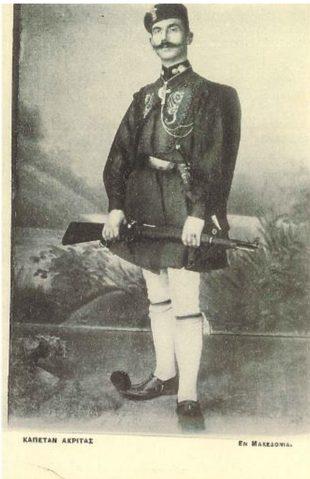
ΚΑΠΕΤΑΝ ΑΚΡΥΓΑΣ ΕΝ ΜΑΚΕΔΟΝΙΑ.