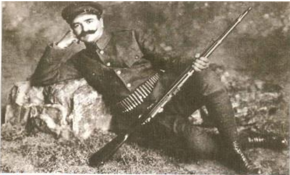
Ο Πολεμιστής Ματσούκας. Πρωτοδημοσιεύτηκε στο Περιοδικό Η Εικονογραφημένη, αρ. 107, Σεπτέμβριος 1913.