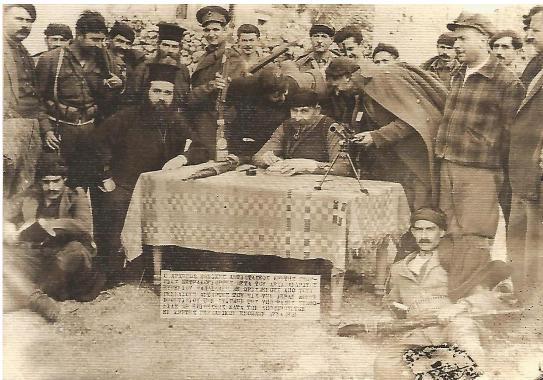
Ο Πετρακογιώργης στην μονή Βροντησίου, κατά την υπογραφή του συμφώνου μη επίθεσης των αποχωρούντων γερμανικών στρατευμάτων.