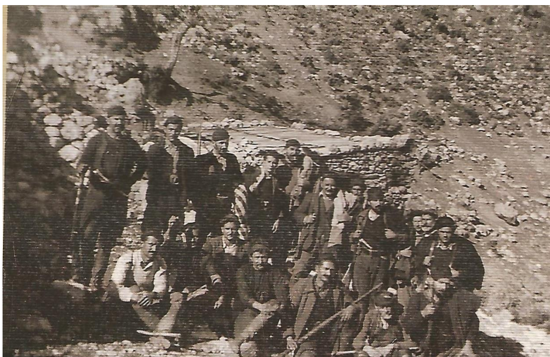
Αντάρτες από την ομάδα του Πετρακογιώργη στα λημέρια του Ψηλορείτη. Ιδιωτικό αρχείο εκπολιτιστικού συλλόγου «Ο Καπετάν Πετρακογιώργης», Μαγαρικάρι