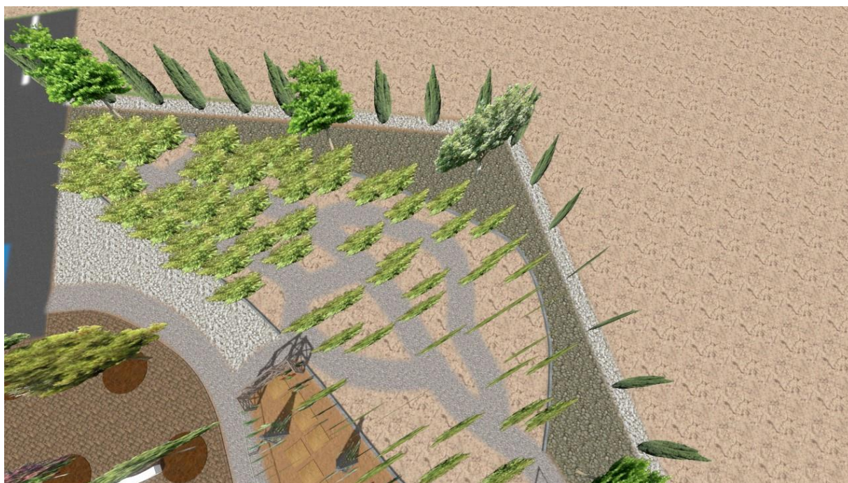
Εικόνα:22 Κήπος των Μπαμπού

Η αριστερή διαδρομή, διακλαδώνεται με διάφορους τύπους μικρών κήπων αποτελούμενους από διάφορα στοιχεία και υλικά όπως το νερό, κατασκευές, φωτισμό. Ο πρώτος κήπος που βρίσκουμε αποτελείται από μπαμπού, οποίος καλύπτει 215τ.μ.