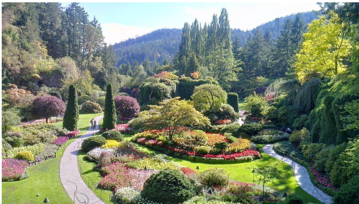
Εικόνα:4 Butchart Gardens