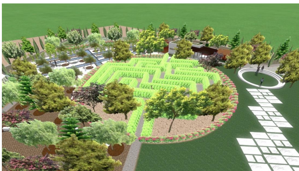
Εικόνα: 18 Κεντρική διαδρομή όπου περνά μέσα από φυτικό λαβύρινθο

Η κεντρική διαδρομή περνά μέσα από ένα φυτικό λαβύρινθο δημιουργημένο από το φυτό Καλλιτρίδα οποίος καλύπτει 687τ.μ. και έχει κυκλικό σχήμα με ακτινα ρίση με 29,5m Ο λαβύρινθος καταλήγει στην κεντρική καφετέρια. Η καφετέρια είναι 33τ.μ κλειστός χώρος και η εξωτερική της καλυπτόμενη αυλή με πέργολα αντιστοιχεί σε 51τμ. Στην πίσω πλευρά της καφετέριας υπάρχουν αποχωρητήρια, αντρικά και γυναικεία αντίστοιχα, τα οποία καλύπτουν χώρο 6,5τ.μ. Οι οροφές της καφετέριας και των αποχωρητηρίων καλύπτονται από σύστημα οροφόκηπου τύπου extensive (χαμηλής βλάστησης). Ενωμένος με την καφετέρια υπάρχει παιχνιδότοπος 290τ.μ. όπου τα παιχνίδια αποτελούνται από 9 ξύλινες κατασκευές. Επίσης ο χώρος σκιάζεται από διάφορα δέντρα για την καλύτερη χρήση του χώρου.