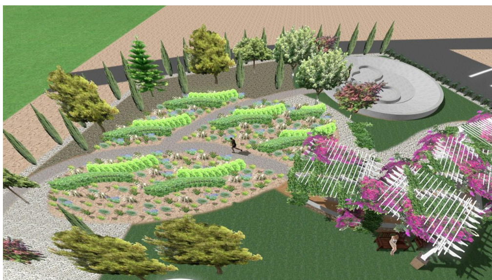
Εικόνα:20 Δεξιά διαδρομή

Η δεξιά διαδρομή περνά μέσα από ξύλινες κατασκευές πέργολας καλυπτόμενες με τα φυτά βουκαμβίλιες και γιασεμιά. Η συγκεκριμένη απόσταση διαδρομής είναι 28m και καταλήγει σε ένα πολύχρωμο κήπο με διάφορα κυπριακά φυτά όπου έχει μια δεξιά διακλάδωση στον χώρο για την πίστα skateboard. Η πίστα αυτή αποτελεί 153τ.μ.