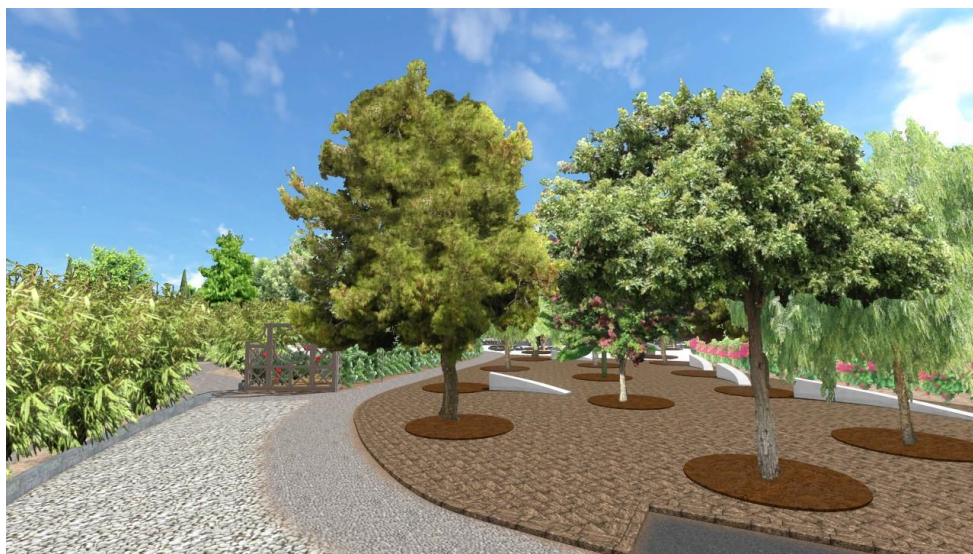
Εικόνα:25 Πλατεία μεταξύ της κεντρικής και αριστερής διαδρομής

Η Δεύτερη πλατεία είναι 592τ.μ. και είναι δημιουργημένη με άσπρο πλακόστρωτο. Κύριο χαρακτηριστικό είναι ο διαχωρισμός του πλακόστρωτου με 5 διασταυρώμενες λωρίδες στατικού νερού σε ορθογώνιο σχήμα. Υπάρχουν επίσης δύο λωρίδες φυτεμένες με παμπού καθώς και 13 στρογγυλές λεκάνες ακτίνας r ίση με 1,5 m φυτεμένες με ελιές. Ακόμη τοποθετήθηκαν τέσσερα άσπρα τοξωτά παγκάκια και έξι παγκάκια σε σχήμα καμπύλης γραμμής.