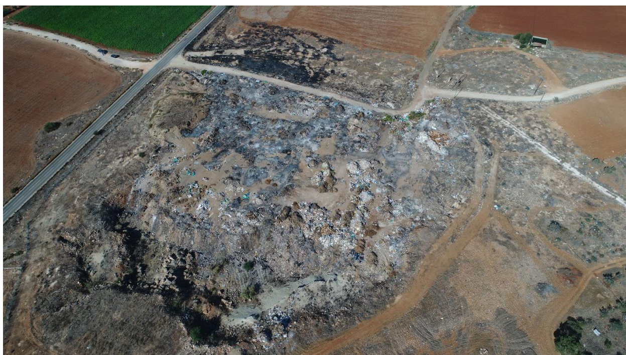
Εικόνα:11 Υφιστάμενη κατάσταση του χώρου μελέτης – εδαφικές κοιλότητες