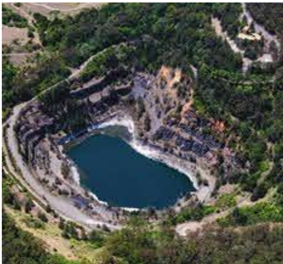
Εικόνα:3 Hornsby Quarry