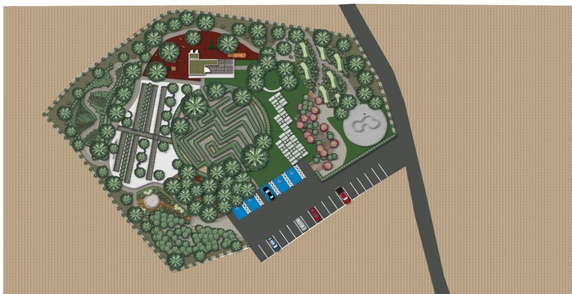
Εικόνα: 16 Κάτοψη μελέτης, σχεδιασμός

Η κεντρική ιδέα για τον σχεδιασμό του χώρου μελέτης είναι η αποκατάσταση της περιβαλλοντικής κατάστασης του χώρου και η δημιουργία πάρκου με διάφορες δραστηριότητες.