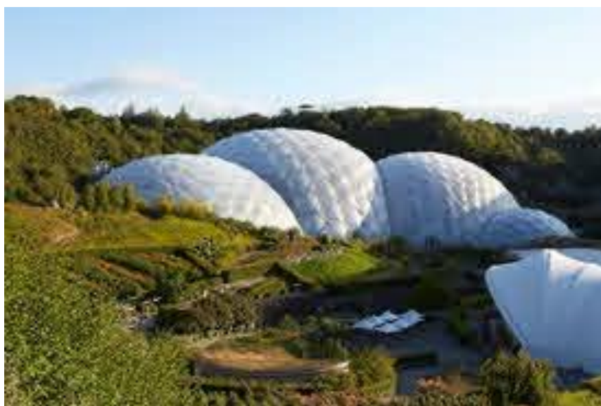
Εικόνα:7 Eden project