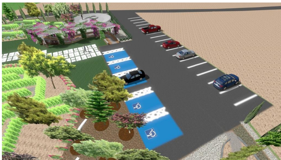
Εικόνα: 17 Χώρος στάθμευσης

Κατά την είσοδο στον χώρο, ξεκινούν διακλαδώσεις για τα διάφορα σημεία δραστηριοτήτων. Η κύριες διαδρομές που υπάρχουν είναι τρεις, με υποκείμενες διακλαδώσεις.