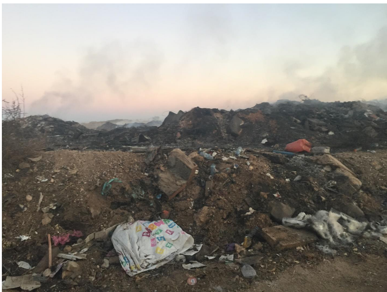
Εικόνα:15 Σκουπίδια και φωτιές