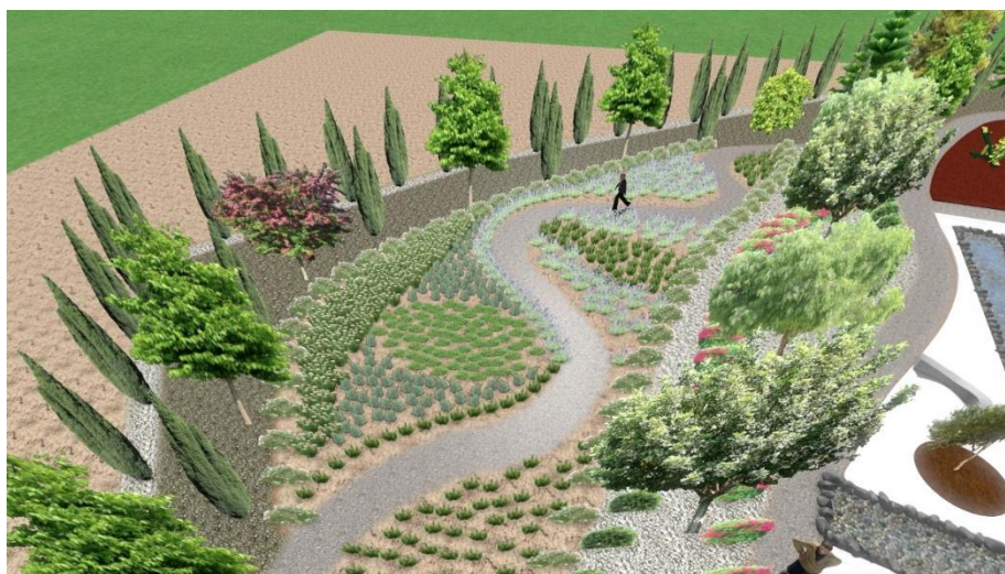
Εικόνα:24 Κήπος των αρωματικών φυτών

Ο τρίτος κήπος που βρίσκουμε είναι ο κήπος των αρωματικών φυτών ο οποίος έχει έκταση 215τ.μ. Η δημιουργία του έγινε με συστάδες αρωματικών φυτών σε ομαδοποίηση.