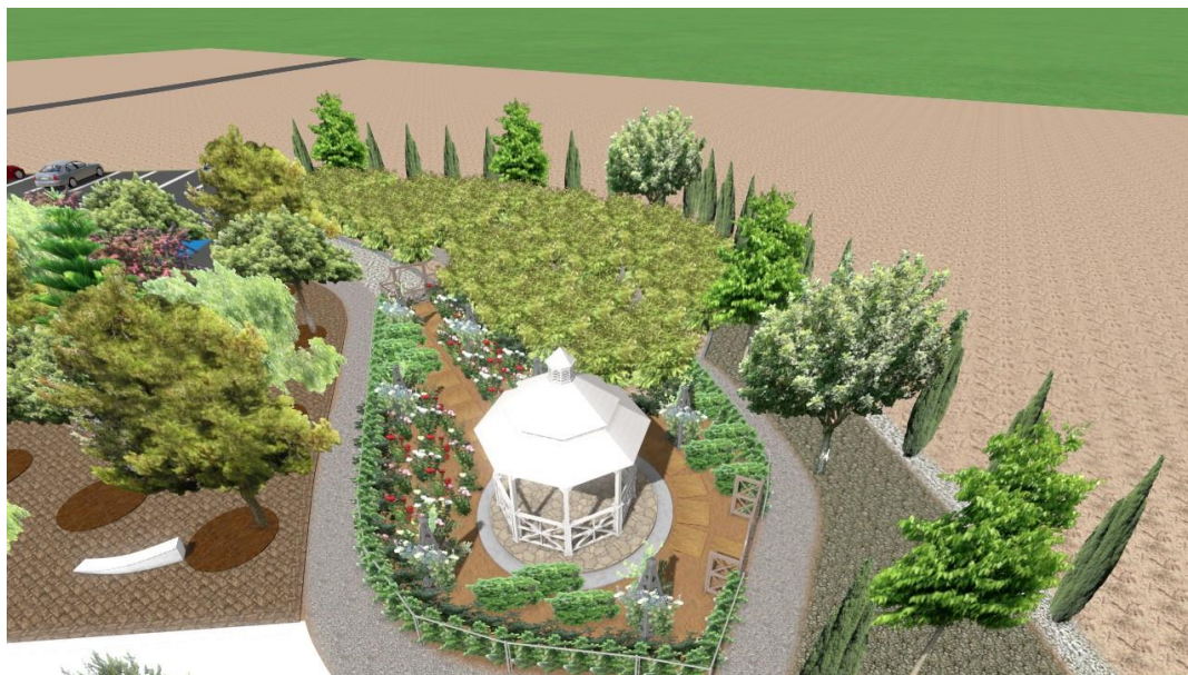
Εικόνα:23 Κήπος των Ρόδων

Ο τρίτος κήπος που βρίσκουμε είναι ο κήπος των αρωματικών φυτών ο οποίος έχει έκταση 215τ.μ. Η δημιουργία του έγινε με συστάδες αρωματικών φυτών σε ομαδοποίηση.