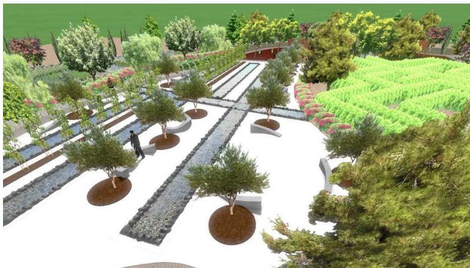
Εικόνα:26 Πλατεία νερού μεταξύ της κεντρικής και αριστερής διαδρομής

Η Δεύτερη πλατεία είναι 592τ.μ. και είναι δημιουργημένη με άσπρο πλακόστρωτο. Κύριο χαρακτηριστικό είναι ο διαχωρισμός του πλακόστρωτου με 5 διασταυρώμενες λωρίδες στατικού νερού σε ορθογώνιο σχήμα. Υπάρχουν επίσης δύο λωρίδες φυτεμένες με παμπού καθώς και 13 στρογγυλές λεκάνες ακτίνας r ίση με 1,5 m φυτεμένες με ελιές. Ακόμη τοποθετήθηκαν τέσσερα άσπρα τοξωτά παγκάκια και έξι παγκάκια σε σχήμα καμπύλης γραμμής.