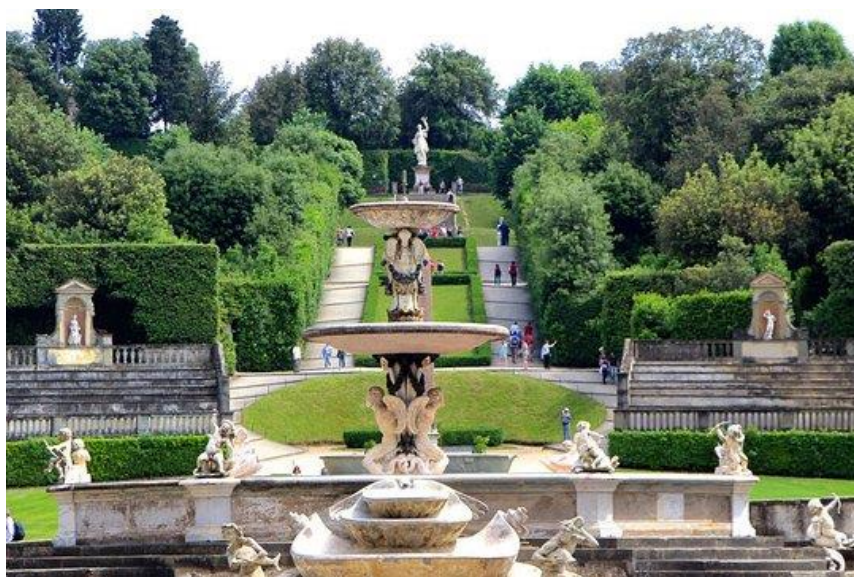
Εικόνα:6 The Boboli Gardens