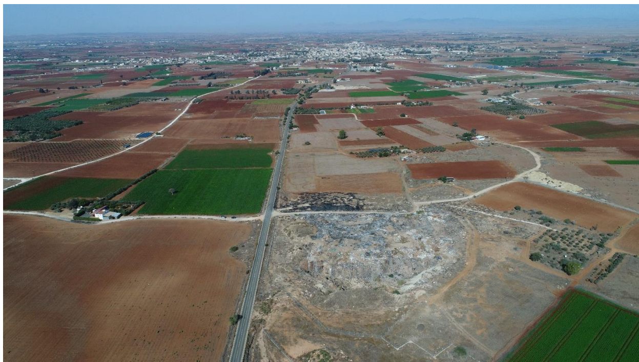
Εικόνα:12 Απόσταση χωριού από το σημείο μελέτης