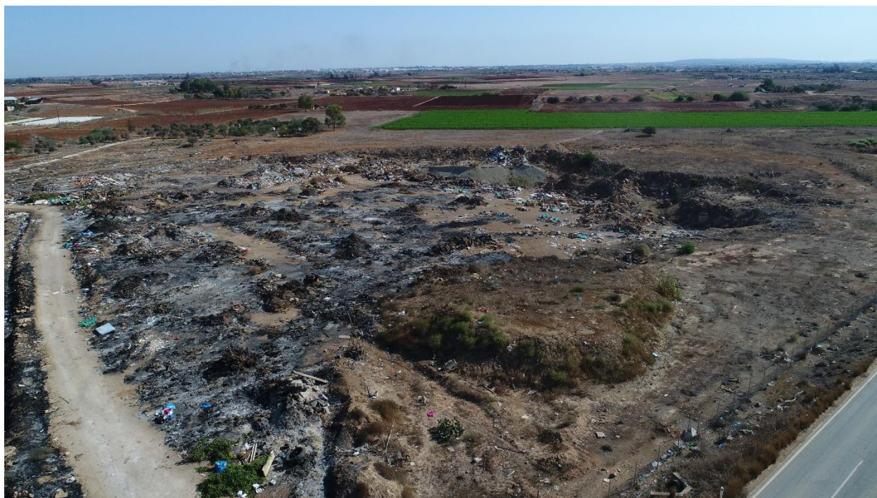
Εικόνα:9 Υφιστάμενη κατάσταση του χώρου μελέτης

Πιο κάτω επισυνάπτεται φωτογραφικό υλικό από την υφιστάμενη κατάσταση στην περιοχή μελέτης.