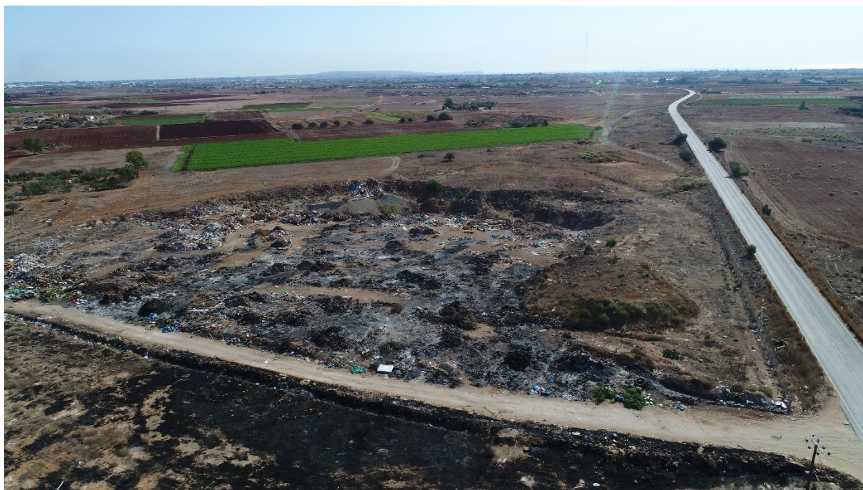
Εικόνα:10 Υφιστάμενη κατάσταση του χώρου μελέτης – εδαφικές κοιλότητες