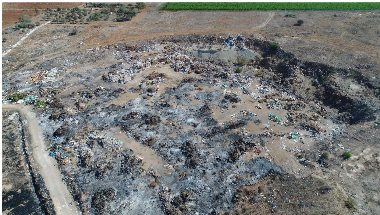
Εικόνα:14 Υφιστάμενη κατάσταση του χώρου μελέτης – εδαφικές κοιλότητες