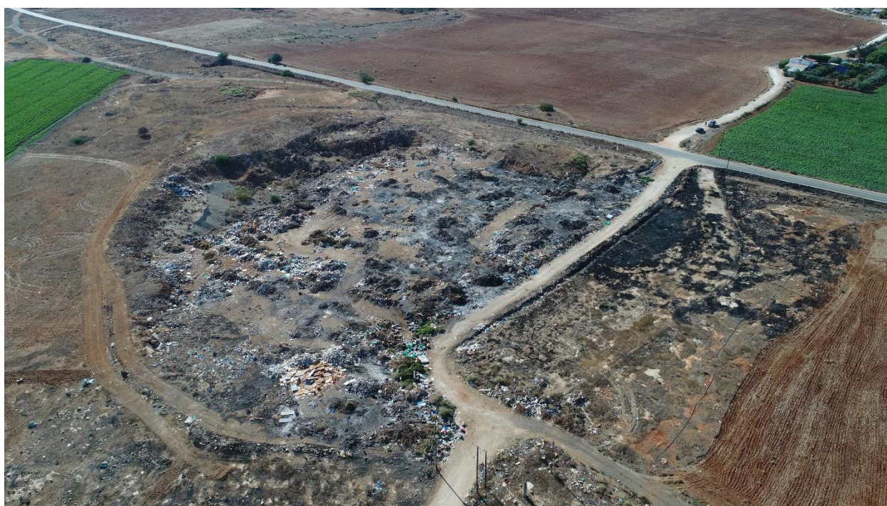
Εικόνα:13 Υφιστάμενη κατάσταση του χώρου μελέτης – εδαφικές κοιλότητες