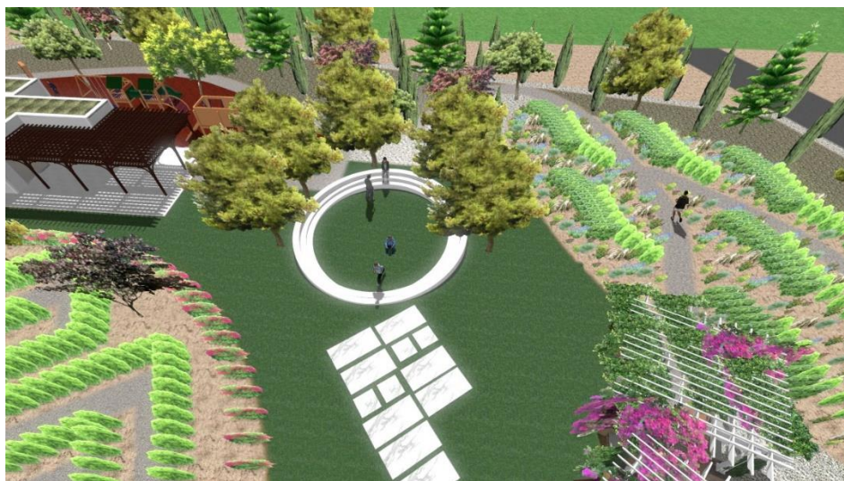
Εικόνα:21 Μικρό κυκλικό αμφιθέατρο μεταξύ κεντρικής και δεξιάς διαδρομής

Η αριστερή διαδρομή, διακλαδώνεται με διάφορους τύπους μικρών κήπων αποτελούμενους από διάφορα στοιχεία και υλικά όπως το νερό, κατασκευές, φωτισμό. Ο πρώτος κήπος που βρίσκουμε αποτελείται από μπαμπού, οποίος καλύπτει 215τ.μ.