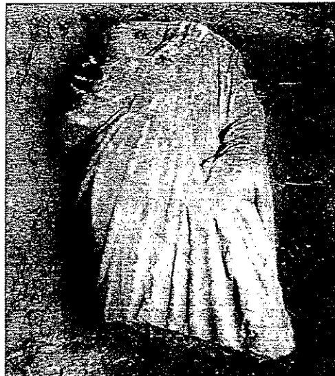
Ветка Црква, с. Прдејци. – Мермерно торзо од римското време

Ветка Црква , сакрален објект од римското време. На североисточната периферија на селото, во непосредната близина на пругата Скопје-Гевгелија се среќаваат грамади од градежен камен и фрагменти од мермерна архитектонска пластика со различна