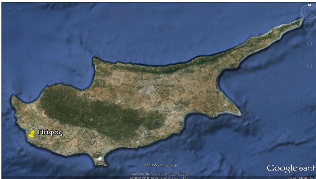
Εικόνα 1: Θέση της Πάφου στον Χάρτη