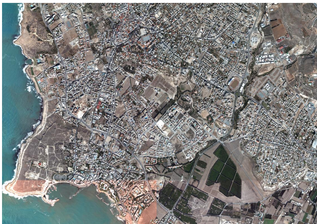
Εικόνα 2: Εναέρια Φωτογραφία της Πάφου