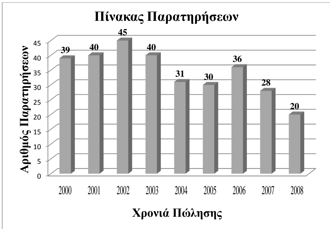
Γράφημα 1: Αριθμός Παρατηρήσεων του Δείγματος ανά Έτος

Στο Γράφημα 1 απεικονίζεται ο αριθμός των πωλήσεων/παρατηρήσεων για κάθε έτος της έρευνας. Θεωρείται ότι οι αριθμοί αυτοί είναι ικανοποιητικοί για όλα τα έτη πλην του έτους 2008 όπου καταγράφονται σχετικά μειωμένες παρατηρήσεις.