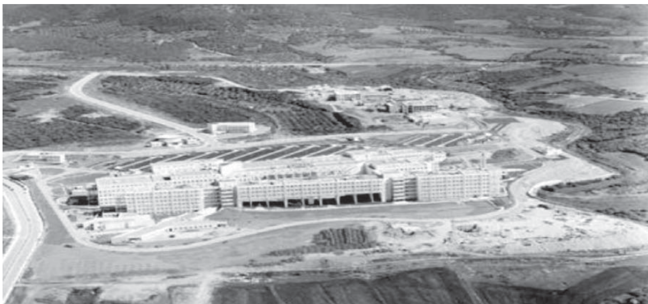
Εικόνα 1: Γενική άποψη του Νοσοκομείου Αλεξανδρούπολης από αεροφωτογραφία. Picture 1: Aerial view of Hospital Alexandroupolis.

Η εργασία αυτή αφορά στην αξιολόγηση και διαμόρφωση του περιβάλλοντος χώρου ενός Νοσοκομείου ενώ παράλληλα σ' αυτήν αναπτύσσονται οι προϋποθέσεις, οι αρχές και οι στόχοι του σχεδιασμού. Ειδικότερα, η παρούσα εργασία αφορά στον σχεδιασμό του Γενικού Νομαρχιακού Πανεπιστημιακού Νοσοκομείου της Αλεξανδρούπολης. Αξιολογείται δηλαδή η κατάσταση του εξωτερικού