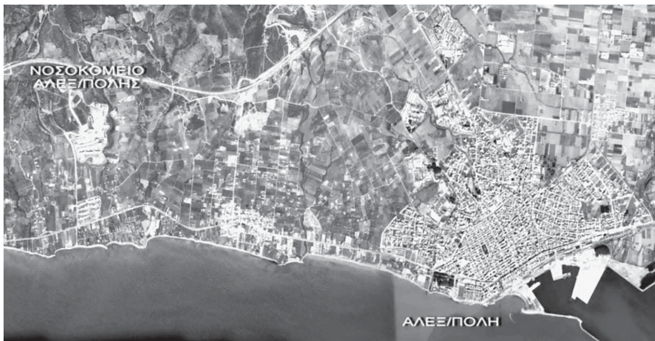
Εικόνα 2: Άποψη της ευρύτερης περιοχής

(Η καταγραφή της βλάστησης έγινε μετά από επιτόπια παρατήρηση από τους συγγραφείς).