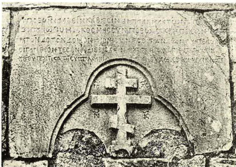
Εἰκ. 5. Μόκιστα. Ναός τοῦ Ἁγ. Νικολάου-παρεκκλήσι τῶν Ταξιαρχῶν: Ἡ ἔμμετρη κτητορική ἐπιγραφή.

Βαρνάκοβας 62 καὶ Μυρτιᾶς 63 («βιβλιογραφικά ἐργαστήρια» ποῦ συνέχισαν ἴσως τὴ δραστηριότητά τους καὶ στὰ μεταβυζαντινὰ χρόνια), ὅπου θὰ ὑπῆρχαν βέβαια καὶ ἀνάλογες βιβλιοθήκες.