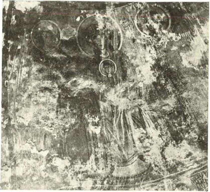
Εικ. 4. "Αγ. Νικόλαος ὁ Κρεμαστός: Ἡ παράσταση τῆς Θεοτόκου-Πλατυτέρας (διακρίνονται καὶ οἱ ἐπιγραφές).

Ἡ δεύτερη συμβολή τῆς μαρτυρίας τοῦ κειμένου πὸ μᾶς ἀπασχολεῖ, ἐκτὸς ἀπὸ τῆ συμβολή του στὴν περιορισμένη ἱστορία τῆς μονῆς τοῦ Κρεμαστοῦ, ἀφορᾷ στὸ γενικότερο πρόβλημα τῆς πνευματικῆς κατάστασης πὸ ἐπικρατοῦσε στὴν περιοχή, ἡ ὁποία λίγο ἀργότερα περιῆλθε στὸ γνωστὸ βυζαντινὸ κρατίδιο, τὸ λεγόμενο Δεσπο-