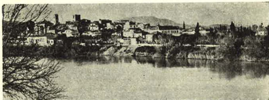
Εἰκ. 1. Βορειοανατολικὴ ἄποψη τῆς Κατοχῆς

Δυτικά ἀπὸ τὸ χωριὸ Νισχώρι τῆς αἰτωλικῆς Παραχελωϊτιδας, στὴν προ- έκταση τοῦ δρόμου ποὺ τὸ ἐνώνει μὲ τὸ Αἰτωλικὸ καὶ τὸ Μεσολόγγι, βρί- σκεται ἡ Κατοχὴ 1 , τὸ πρῶτο ἀκαρνανικὸ χωριὸ ποὺ συναντᾷ ὁ ἐπισκέπτης διαβαίνοντας τὸν ποταμὸ Ἄχελῶο ἀπὸ τὴν Αἰτωλία στὴν Ἀκαρνανία. Τὸ ση- μερινὸ χωριὸ εἶναι χτισμένον πάνω σὲ μικρὸ λόφο ποὺ οἱ πρόποδες του ἀγγίζου- ν τὴ δεξιὰ ὄχθη τοῦ Ἄχελῶου 2 . Στὸ σημεῖο αὐτὸ ὁ ποταμὸς στενεύει περισσό- τερο καὶ σχηματίζει κάποιον φυσικὸ πόρο ποὺ διευκολύνει τὴ διάβασή του.