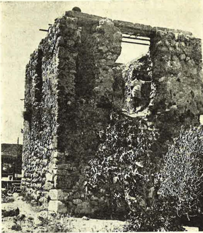
Εἰκ. 4. Νοτιοανατολική ἄποψη τοῦ πύργου

τος 0.90 μ. καὶ καταλαμβάνει σὲ μήκος ὀλόκληρο τὸ ὕψος τοῦ διατηρημένου τμήματος τοῦ πρώτου ὀρόφου (βλ. εἰκ. 4.).