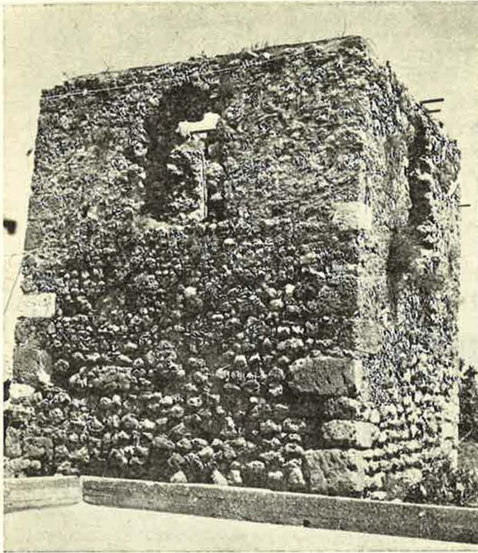
Εικ. 3. Νοτιοδυτική άποψη του πύργου

και ως παρατηρητήρια τῶν βιγλατόρων. Ἄς προστεθεῖ τέλος ὅτι στὸ δεύτερο διαμέρισμα ὁ χώρος ἦταν διαθέσιμος και γιὰ τὴ διαμονὴ προσωπικοῦ, ἐνῶ ἡ θύρα εἰσόδου ἀνοίγεται στὸ ὕψος τοῦ πρώτου ὀρόφου γιὰ λόγους ἀσφαλείας.