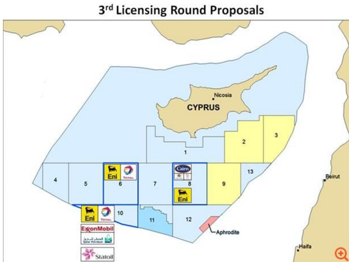
43 Εικόνα 4: Τρίτος Γύρος Αδειοδότησης Κυπριακής ΑΟΖ

Τα κοιτάσματα υδρογονανθράκων, οδήγησαν την Κύπρο και τις γειτονικές τις χώρες Αίγυπτο, Ελλάδα και Ισραήλ να οριοθετήσουν την ΑΟΖ τους, με κύριο σκοπό την οικονομική ανάπτυξη.