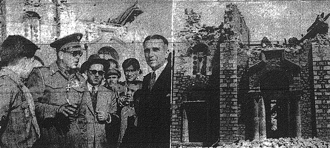
Ο Βασιλεὺς μετὰ τοῦ Διοδοχου συνομιλοῦν μετ' ὀψουργῶν Προινάξ κ. Σολωμῆν ἑνώπιον ἑνὸς κρατουμένου ναοῦ τῶν Σοφῶν.