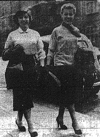
Ἡ ἑλληνιστῆς ἑλπίδα τῆς ἀγγλικῆς τηλεοράσεως...