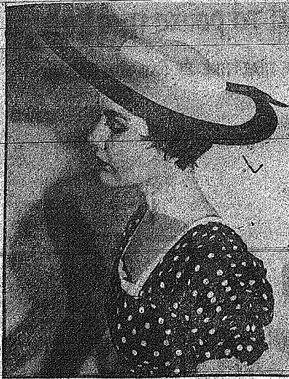
Η πρώτη κυρία του Ηνωμένου Πολιτείου φέρει ένα καπέλο που ονομάζεται 'cap of the president's wife'.