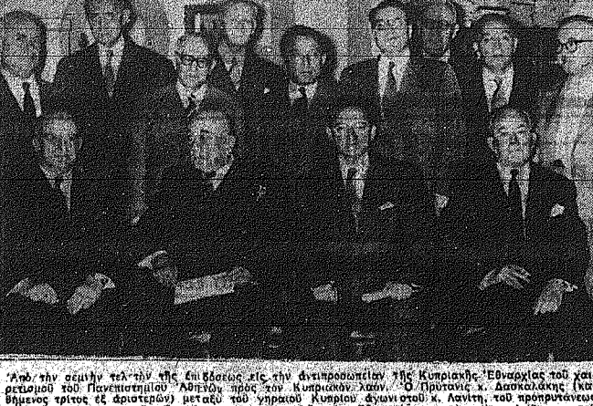
Ο ΠΡΟΪΚΤΗΣ ΤΗΣ ΚΥΠΡΟΣ... Η ομάδα με τον Πρωτόψαλο...