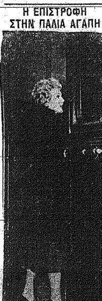
Η ΕΠΙΣΤΡΟΦΗ ΣΤΗΝ ΠΑΛΙΑ ΑΓΑΠΗ