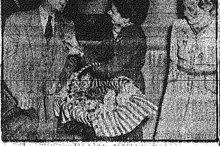
Ο Άγγλος... Ο Άγγλος... Ο Άγγλος...