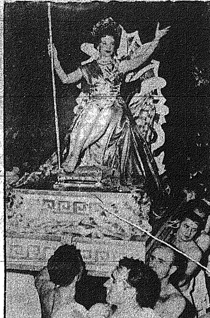
Η ΚΑΛΩΝΕΥΣΗ ΤΗΣ ΟΝΕΙΡΩΔΕΣ ΚΕΡΡ