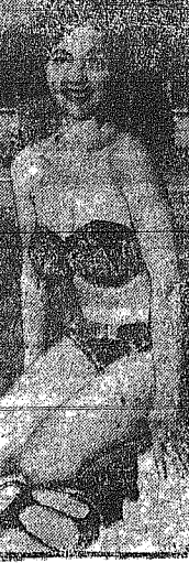
Ο ΑΡΙΖΟΝΑ... Η φωτογραφία...