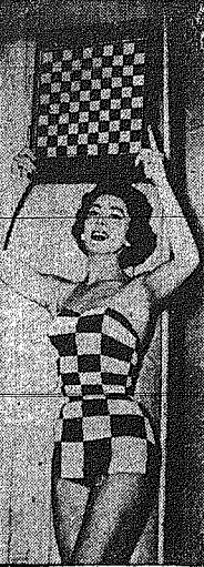
ΕΙΣ ΤΗΝ ΓΕΡΜΑΝΙΑΝ