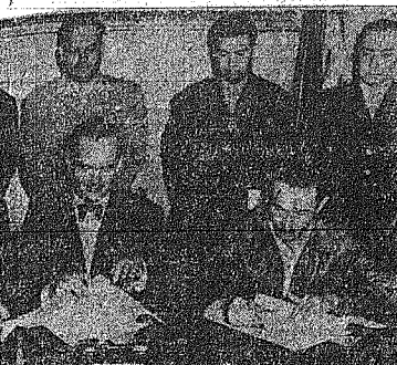
Οι άνωθεν αριστερά: ο Γουατεμαλάς, ο Γουατεμαλάς, ο Γουατεμαλάς...