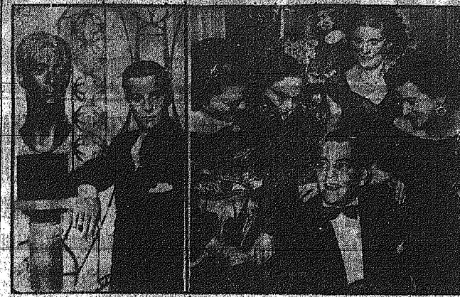
Μετὰ ἀπὸ δεκάετην ἐπιπέτυχιν...