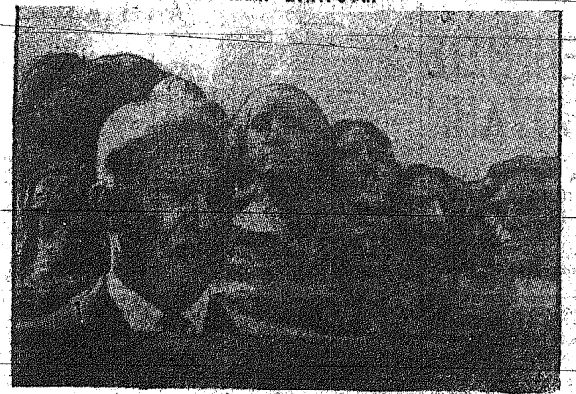
Είς τόν μεγαλύτερον διαγωνισμό φωτογράφων...