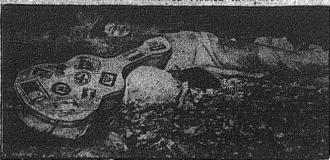
Ενας πανόδοτος Γάλλος κιβαρόδος περιέρχεται ἐπὶ 25 χρόνια...