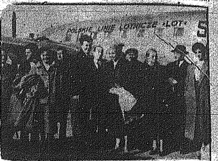
Ὁ Φάουκ ἀπὸ δὲλεξε τὴν Χάρις...