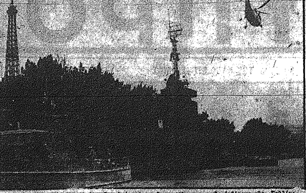
Είς τὸ Παρίσι, ἔγινον πρὸ ἡμερῶν τὸ ἀναγκαίον ἐπισημὸν ἐκθέσεων τῆς Γαλλίας...