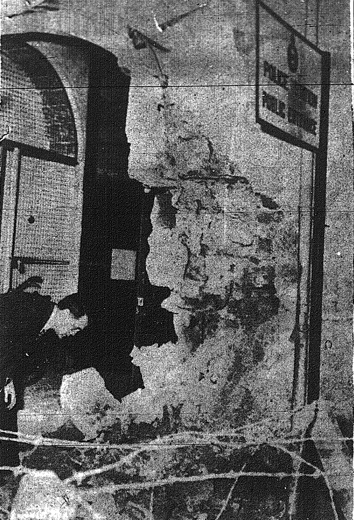
Η είσοδος του αστυνομικού σταθμού Λευκωσίας μετά την έκρηξη της δολοφονικής βόμβας...