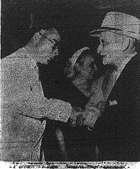
Ο Άγγλος Πρέσβης...