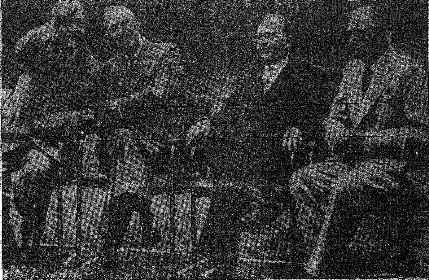
Μία από τας κληρώτερας φωτογραφίας των τεσσάρων Μεγάλων, οι οποίοι συνεδρίαζον καθ' Ελλην την ημερίδα...