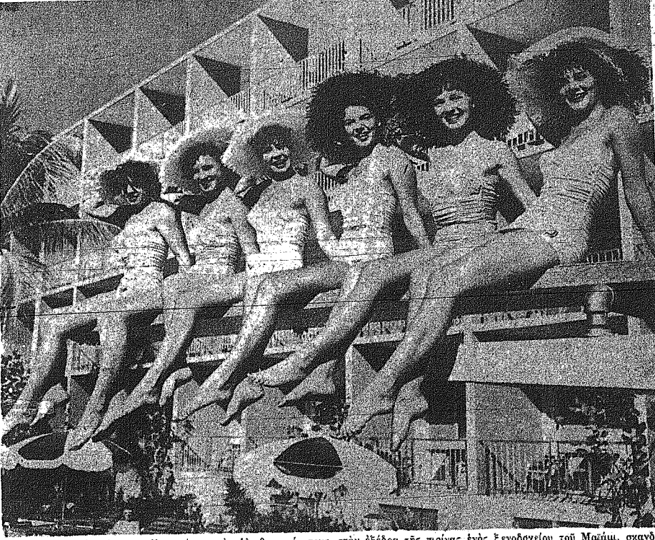
Έξ ηλιοθεραπευτικής Αμερικανίδος κάνουν την ηλιοθεραπεία τους στην εξέδρα της ποινας ενός ξενοδοχείου του Μαΐαμι, οκτανόηρου, ζώντας τους εκατομμυριούχους του Νέου Κόσμου, που ήλθαν στην ηλιόλουστη Φλόριδα για να αναπαυθούν.