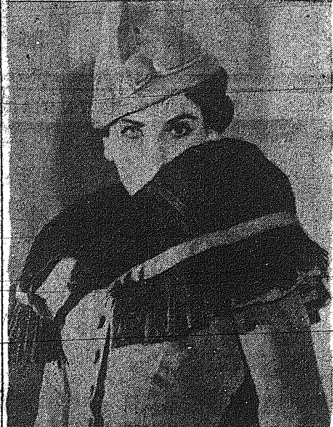
Τα κολλάρια των φροντιστών άρτυσαν το ψυχήν, όπως φαίνεται από το φωτογραφικό κείμενο...