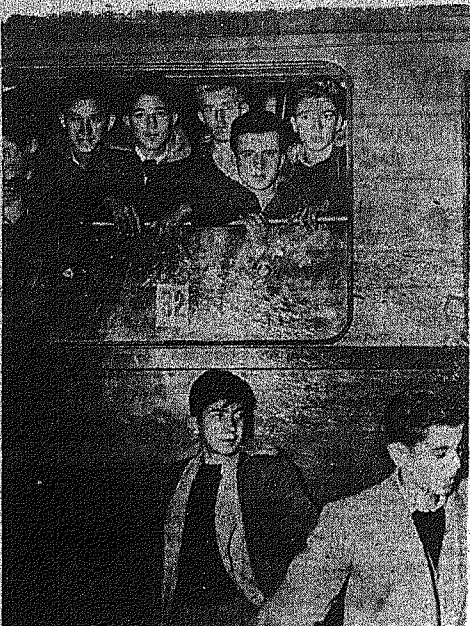
Ελληνοπαίδες εκ Καλαβρίας αναχωρούν εις Δυτικήν Γερμανίαν δια να εκπαιδευθώ τεχνικώς ως λιπαστροφοί μεγάλων Γερμανικών οίκων.