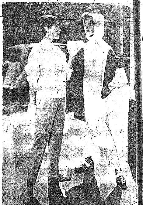
Και η μόδα εις τις γυναικείες πυζάμες εξελίσσεται διαρκώς. Ανωτέρω δύο πρωτότυπα μοντέλα της κοστίζης σιγής.