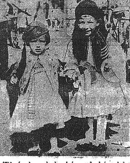
Ελληνόπουλα κατά τήν ημέραν τού έρανου υπέρ τού Κυπριακού Αγώνος.

ΥΠΟ ΤΟ ΦΩΣ ΤΗΣ ΕΠΙΣΤΗΜΗΣ... ΠΟΣΟΝ ΥΠΝΟΝ ΧΡΕΙΑΖΕΤΑΙ Ο ΑΝΘΡΩΠΟΣ;