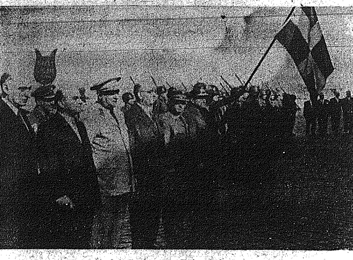
Ο Έλληνας πρεσβευτής εν τώ μέσω των Τούρκων επί σήμων κατά την τελετή της άπονομής τιμών εις την Έλληνικήν σημαίαν εν Σμύρνη.