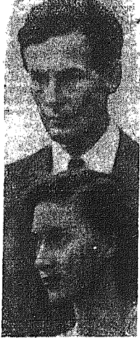
Ο Αρχιεπίσκοπος δόκτωρ Φίσερ επίλεξε το «Νταϊνλ Μίρρορ»...