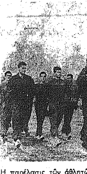
Η παρελθούσα των αθλητών, εις τα Αρκαδία.