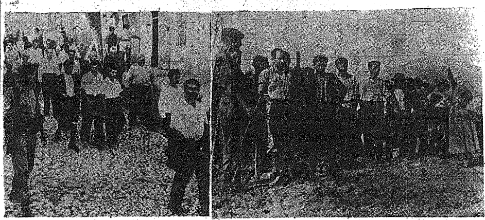
Μερικοί σκηνά από την δράσιν των Βρετανικών στρατευμάτων εις την Κυπριακήν Υπαίθρον: 1) Κυρραίοι κερμαίντος οδηγούν συλλογιστήν Κυπρίων χωρικών προς ανάκριση. 2) Κίτακοι και Κωλαίοι διπιδεν συρματοπλεγμάτων αναμένοντες να ανακριθών.

ΑΠΟ ΤΗΝ ΣΤΡΑΤΙΩΤΙΚΗΝ ΔΡΑΣΙΝ ΕΙΣ ΤΗΝ ΥΠΑΙΘΡΟΝ