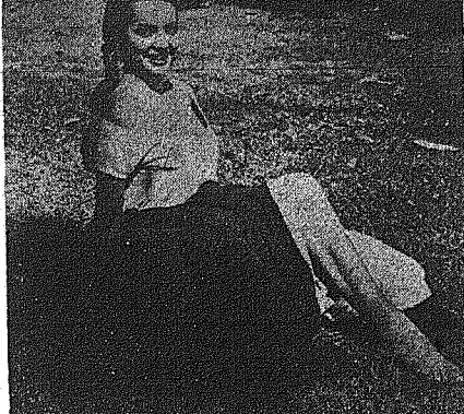
Ἡ μεξικανικὴ καταγωγὴ δόραστὴ ἰθυσίδας Σαρντὸ Μοντιέ, ποὺ μεσουραεῖ εἰς τὴν κίτινον «Βέβα Κρούζ», ποὺ παίζεται τὰρα εἰς τὴν Ἀθήνα.