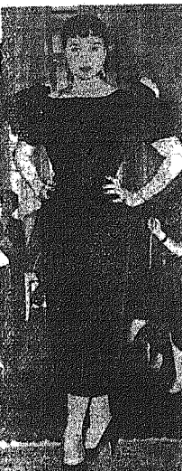
Βροδυό φόρεμα 'Αγγλικού σίκου.