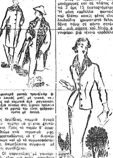
Άριστο μαντί τριφύλλο φ-πο λανός με γακκά...