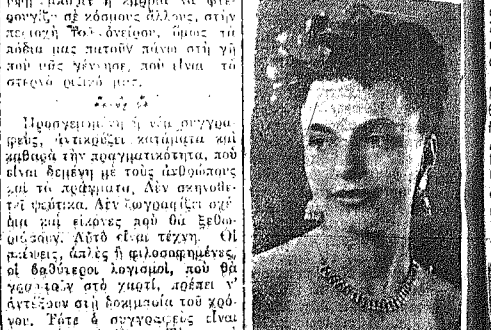
Η συγγραφέας του έργου...