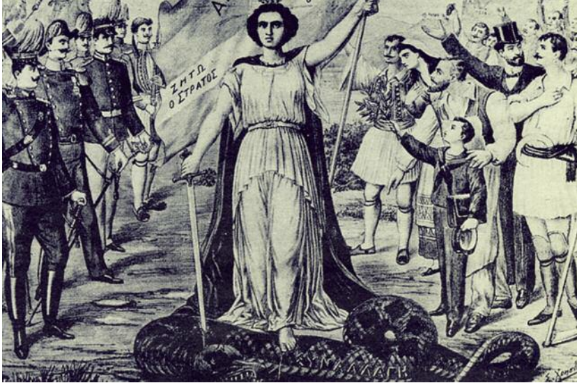
Γκραβούρα εποχής για την αναγέννηση που έφερε το κίνημα του 1909 στη χώρα.

λειτουργούσε αποσταθεροποιητικά στη λειτουργία του πολιτικού συστήματος. Η τάση αυτή ενισχυόταν ως αποτέλεσμα της διάχυτης αμφιβολίας της κοινής γνώμης σχετικά με την αποδοτικότητα των υφιστάμενων πολιτικών κομμάτων συνολικά. Κάτω από αυτές τις συνθήκες, η διάδοση απόψεων που δεν στρέφονταν εναντίον αποκλειστικά του ενός ή του άλλου κομματικού σχηματισμού, αλλά αμφισβητούσαν ανοιχτά το ίδιο το κοινοβουλευτικό πολίτευμα (ή –σε πιο ακραίες περιπτώσεις– ακόμα και την ιδέα του συνταγματικού κράτους) έβρισκαν πρόσφορο έδαφος, υπογραμμίζοντας έτσι περαιτέρω το αδιέξοδο στο οποίο είχε σταδιακά περιέλθει η ελληνική πολιτική ζωή. Η ουσιαστική χρεοκοπία των «παλαιών» κομ-