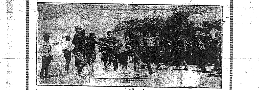
ΧΟΡΟΣ ΣΤΡΑΤΙΩΤΩΝ ΕΙΣ ΑΘΗΝΑΣ ΚΑΤΑ ΤΟ ΠΑΣΧΑ