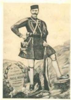
"Στρατιώτης από το Σερβικό αλ Κορσάκι της 22 "Soldier from the Serbian al Korsaki of the 22"