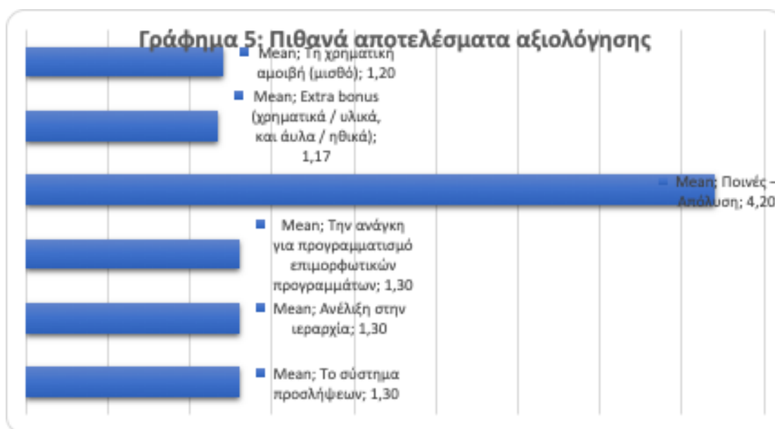
Γράφημα 5. Πιθανά αποτελέσματα αξιολόγησης

Στον Πίνακα 13, φαίνεται ότι η πλειοψηφία, με ποσοστό 93.3%, δεν έχει αμφισβητήσει ποτέ τα αποτελέσματα της αξιολόγησης της απόδοσής τους, ενώ για το 6.7% των ερωτηθέντων ισχύει το αντίθετο.