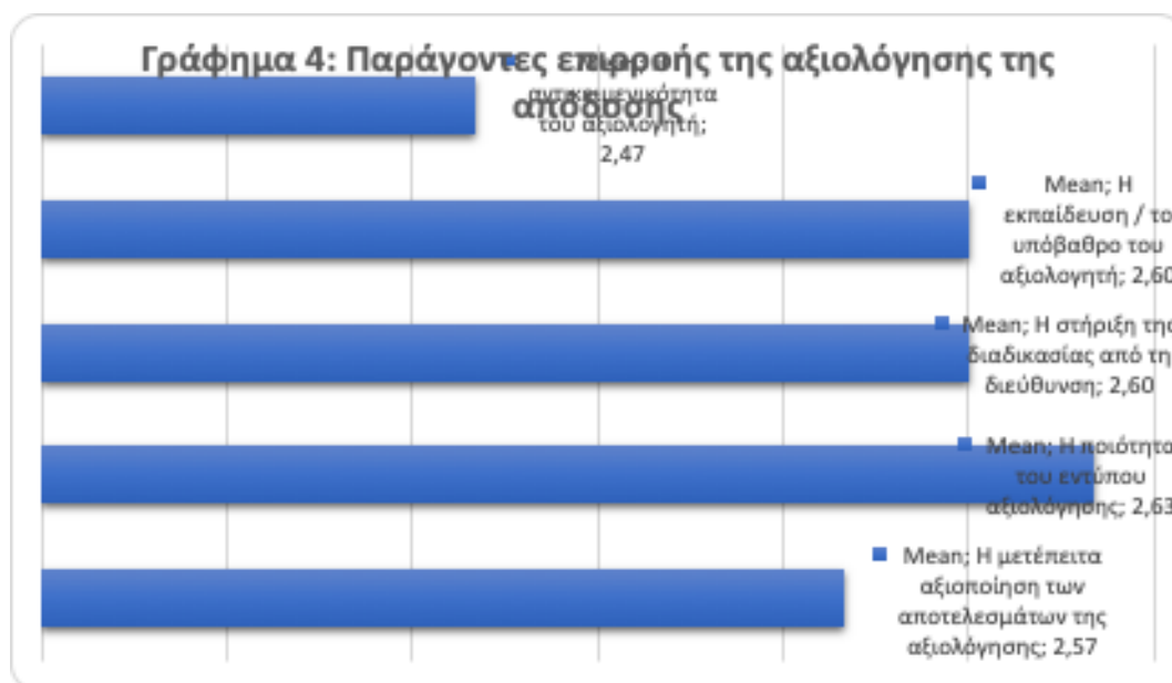
Γράφημα 4. Παράγοντες επιρροής της αξιολόγησης της απόδοσης

Στον Πίνακα 12 και Γράφημα 5 που ακολουθεί, παρουσιάζεται η άποψη των ερωτηθέντων όσον αφορά τα αποτελέσματα που είναι πιθανόν να συνδέονται με την αξιολόγηση της απόδοσής τους. Όπως και προηγουμένως, οι απαντήσεις δέχονται τιμές από το 1 έως το 5 (1-Πάρα πολύ, 2-Πολύ, 3-Αρκετά, 4-Λίγο, 5-Καθόλου) με την αύξηση του μέσου όρου να ταυτίζεται με τη μείωση της επιθυμητής σύνδεσης του εκάστοτε παράγοντα με το αποτέλεσμα της αξιολόγησης της απόδοσης των ερωτηθέντων. Οι εργαζόμενοι θεωρούν ότι η απόλυση ή κάποιου είδους ποινή συνδέεται «Λίγο» με την αξιολόγηση (4.20), ενώ ανάμεσα στο «Πάρα πολύ» και το «Πολύ», με τάση προς το πρώτο, πιστεύουν ότι συνδέεται η ανάγκη για προγραμματισμό επιμορφωτικών προγραμμάτων (1.30), η ανέλιξη στην ιεραρχία (1.30) και το σύστημα προσλήψεων (1.30). Τέλος, πιστεύουν ότι η χρηματική αμοιβή (1.20) και το extra bonus (1.17) είναι «Πάρα πολύ» συνδεδεμένα με την αξιολόγηση της απόδοσής τους που γίνεται από την υπηρεσία τους.