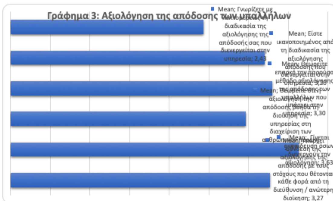
Γράφημα 3. Αξιολόγηση της απόδοσης των υπαλλήλων

Στον παρακάτω Πίνακα 11 και Γράφημα 4, παρατίθενται οι απόψεις των ερωτηθέντων ως προς τον βαθμό επιρροής των παρακάτω παραγόντων στο αποτέλεσμα της αξιολόγησης της απόδοσής τους. Όπως και προηγουμένως, οι απαντήσεις δέχονται τιμές από το 1 έως το 5 (1-Πάρα πολύ, 2-Πολύ, 3-Αρκετά, 4-Λίγο, 5-Καθόλου) και καθώς αυξάνεται ο μέσος όρος, τόσο μειώνεται η επιρροή του εκάστοτε παράγοντα στην επιτυχία-αποτυχία της αξιολόγησης της απόδοσής τους. Μεταξύ των απαντήσεων «Πολύ» και «Αρκετά», με τάση προς το δεύτερο, τοποθετείται η επιρροή των παραγόντων της ποιότητας του εντύπου αξιολόγησης (2.63), της εκπαίδευσης και του υπόβαθρου του αξιολογητή (2.60) και της στήριξης της διαδικασίας από τη διεύθυνση (2.60). Τέλος, στην ίδια κλίμακα, με τάση προς το «Πολύ», θεωρούν οι ερωτηθέντες ότι η αντικειμενικότητα του αξιολογητή επηρεάζει την αξιολόγηση της απόδοσής τους (2.47).