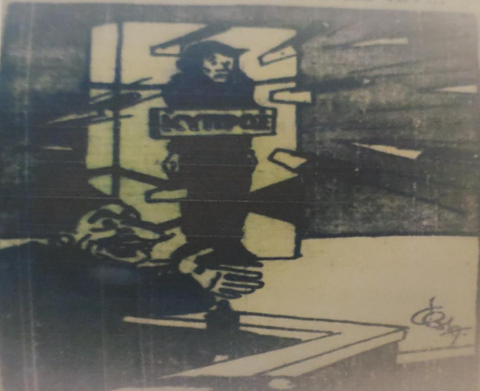
Λέγεται, μπερ' υκισορρηδες! Λίγο σάβρα και δά την παύχεται!