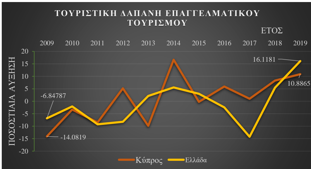
Διάγραμμα 2: Τουριστική δαπάνη επαγγελματικού τουρισμού (ποσοστιαία αύξηση) 2009-2019