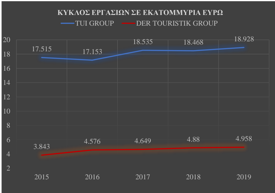
Διάγραμμα 4: Κύκλος εργασιών σε εκατομμύρια ευρώ TUI & DER Touristik (2015-2019)

εξαγορά του διαφοροποιημένου ΤΟ ΚΥΟΝΙ, αναπτύσσει (από το 2014) και εξελίσσει (2016) τη στρατηγική αειφορίας της “Committed to the World”, την οποία υλοποιεί σε συνεργασία με το μη κερδοσκοπικό ίδρυμα του ομίλου DER Touristik Foundation (ίδρυση 2014).