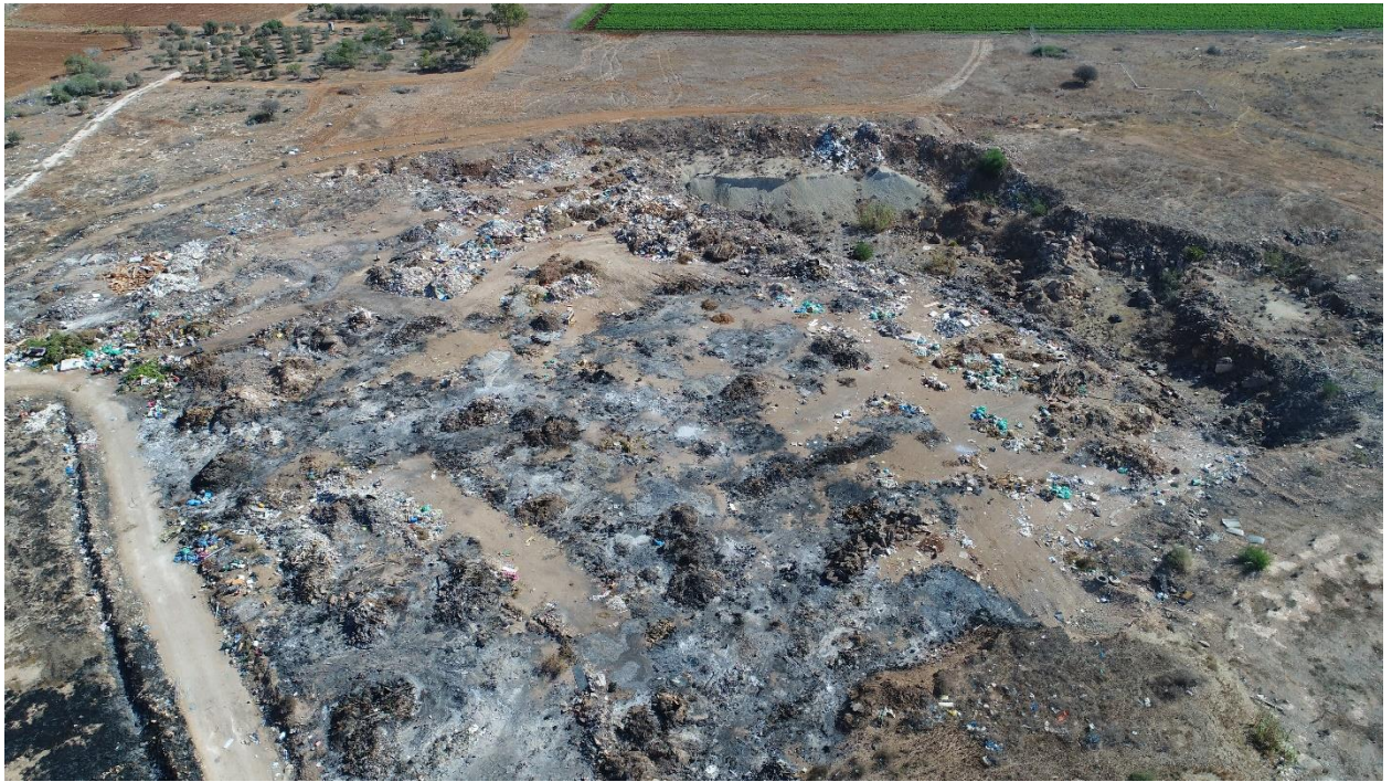
Εικόνα:14 Υφιστάμενη κατάσταση του χώρου μελέτης – εδαφικές κοιλότητες