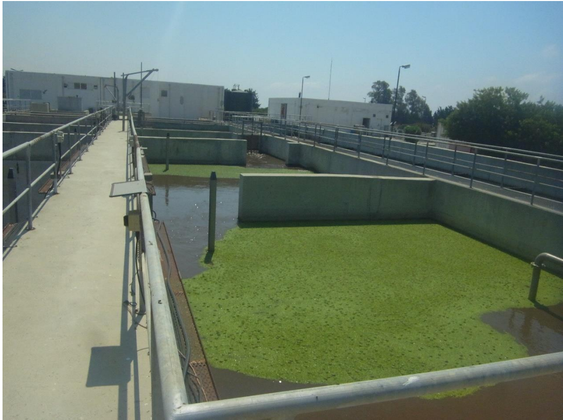
Εικόνα 10: Εγκαταστάσεις βιολογικής επεξεργασίας