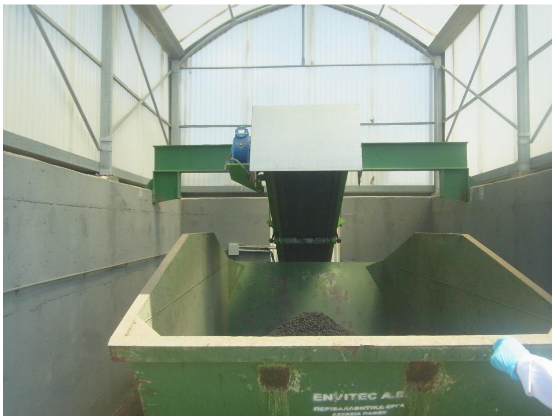
Εικόνα 27: Εγκαταστάσεις επεξεργασίας ιλύος.