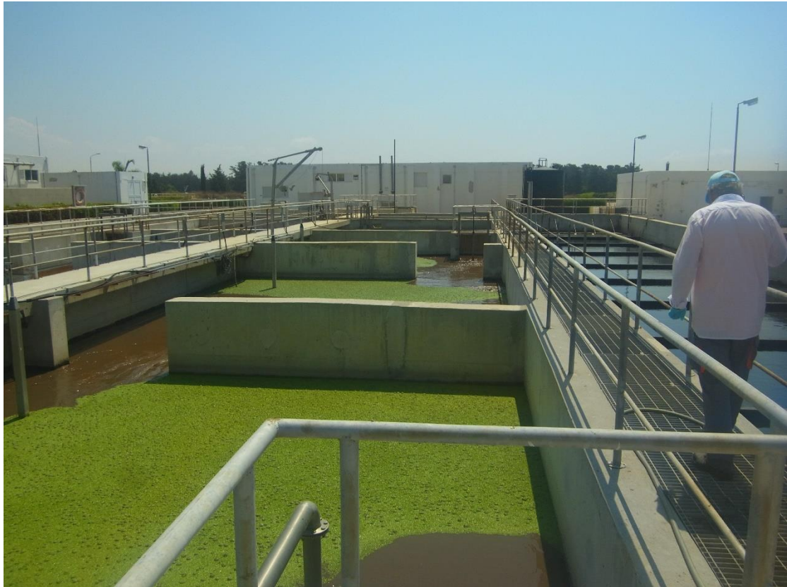
Εικόνα 12: Εγκαταστάσεις βιολογικής επεξεργασίας