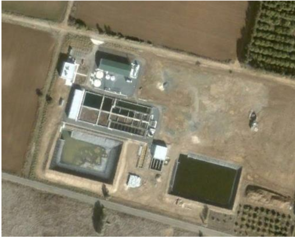
Εικόνα 2: Πρώτη φάση κατασκευής της Μ.Ε.Α.Υ.Α. Πάφου