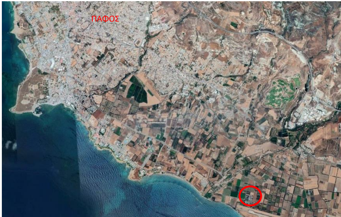
Εικόνα 1: Θέση μονάδας ως προς την πόλη της Πάφου

Στην Εικόνα 2 παρουσιάζεται η πρώτη φάση κατασκευής της μονάδας το έτος 2002, η οποία περιλάμβανε βιολογική επεξεργασία Ε.Ι. Στην Εικόνα 3 παρουσιάζεται η τωρινή εγκατάσταση η οποία όπως προαναφέρθηκε περιλαμβάνει 3 στάδια κατασκευής.