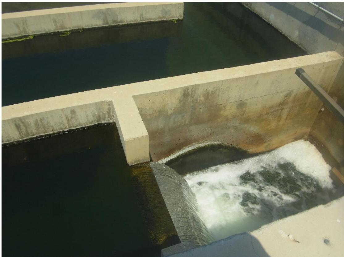
Εικόνα 33: Δεξαμενή Χλωρίωσης.