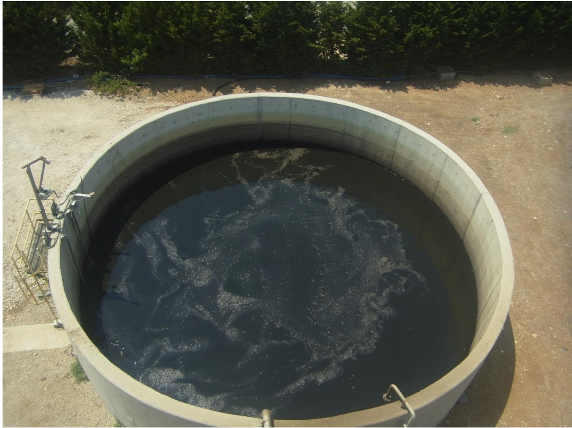
Εικόνα 25: Εγκαταστάσεις επεξεργασίας ιλύος.