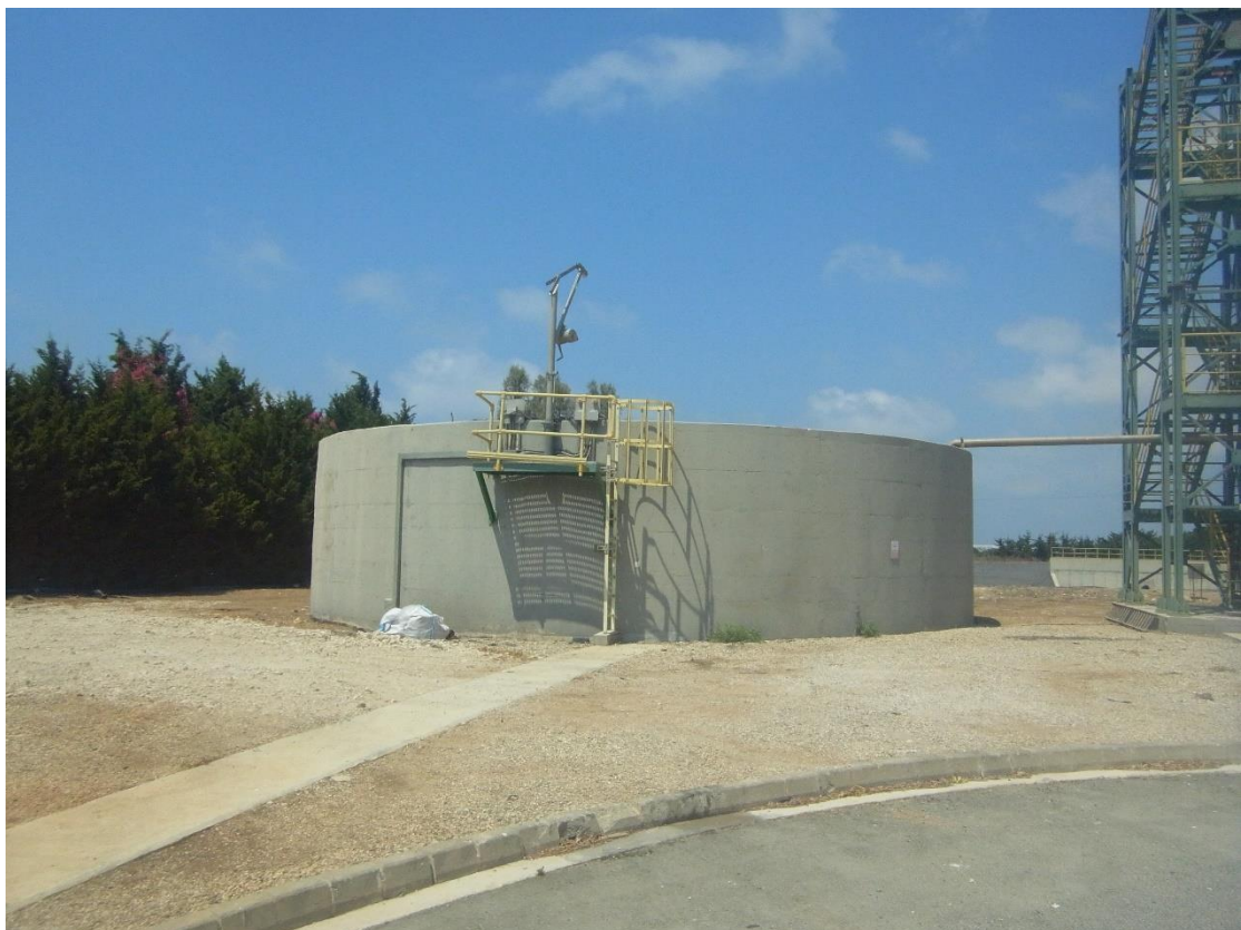
Εικόνα 24: Εγκαταστάσεις επεξεργασίας ιλύος.