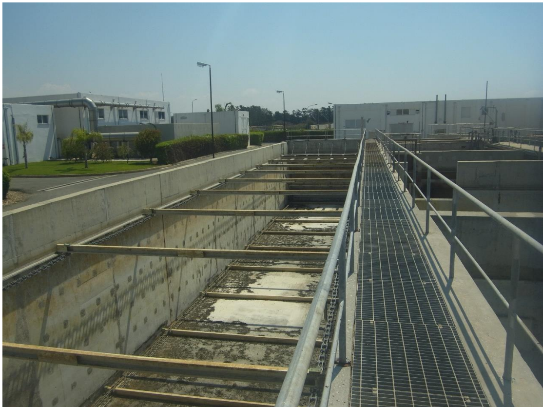
Εικόνα 9: Εγκαταστάσεις βιολογικής επεξεργασίας