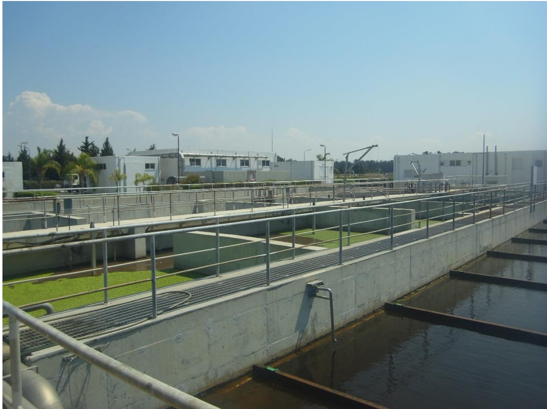
Εικόνα 18: Εγκαταστάσεις βιολογικής επεξεργασίας