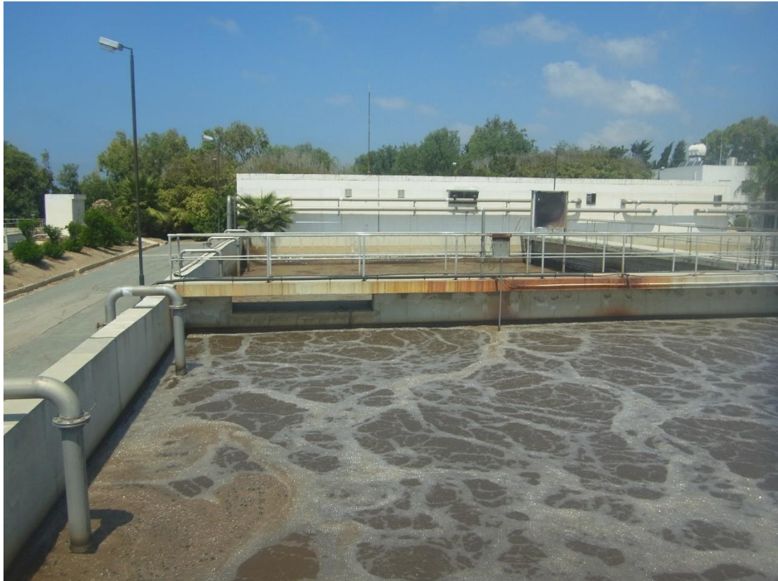
Εικόνα 16: Εγκαταστάσεις βιολογικής επεξεργασίας