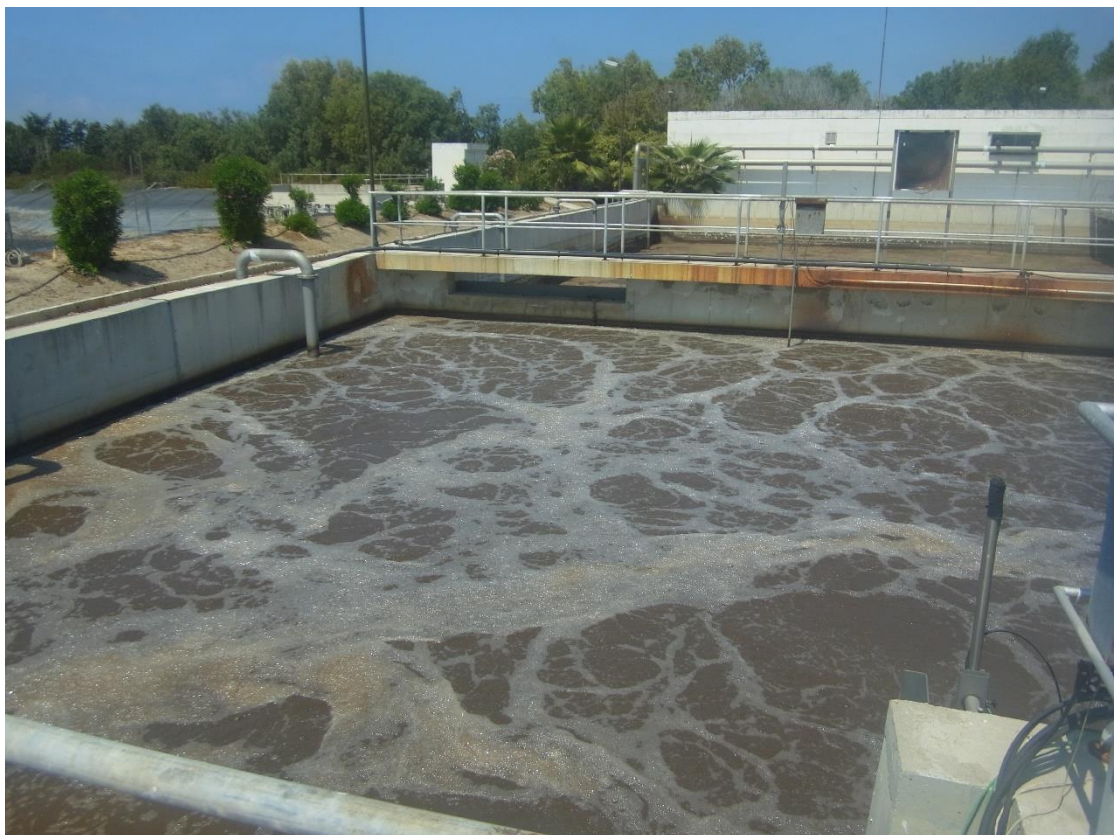
Εικόνα 13: Εγκαταστάσεις βιολογικής επεξεργασίας