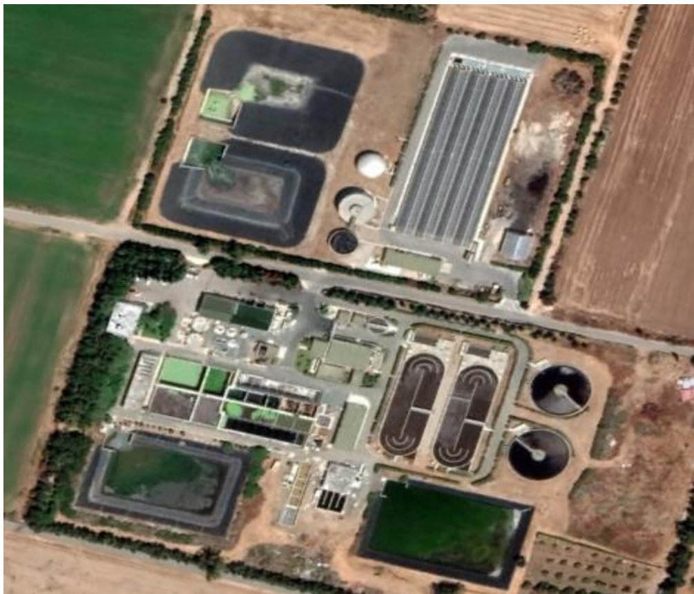
Εικόνα 3: Τωρινή κατάσταση μονάδας.