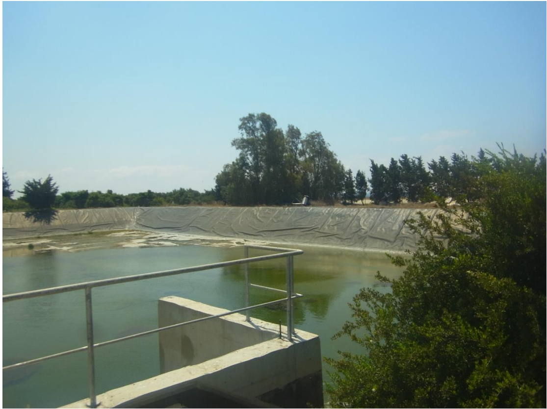
Εικόνα 5: Δεξαμενή έκτακτης ανάγκης