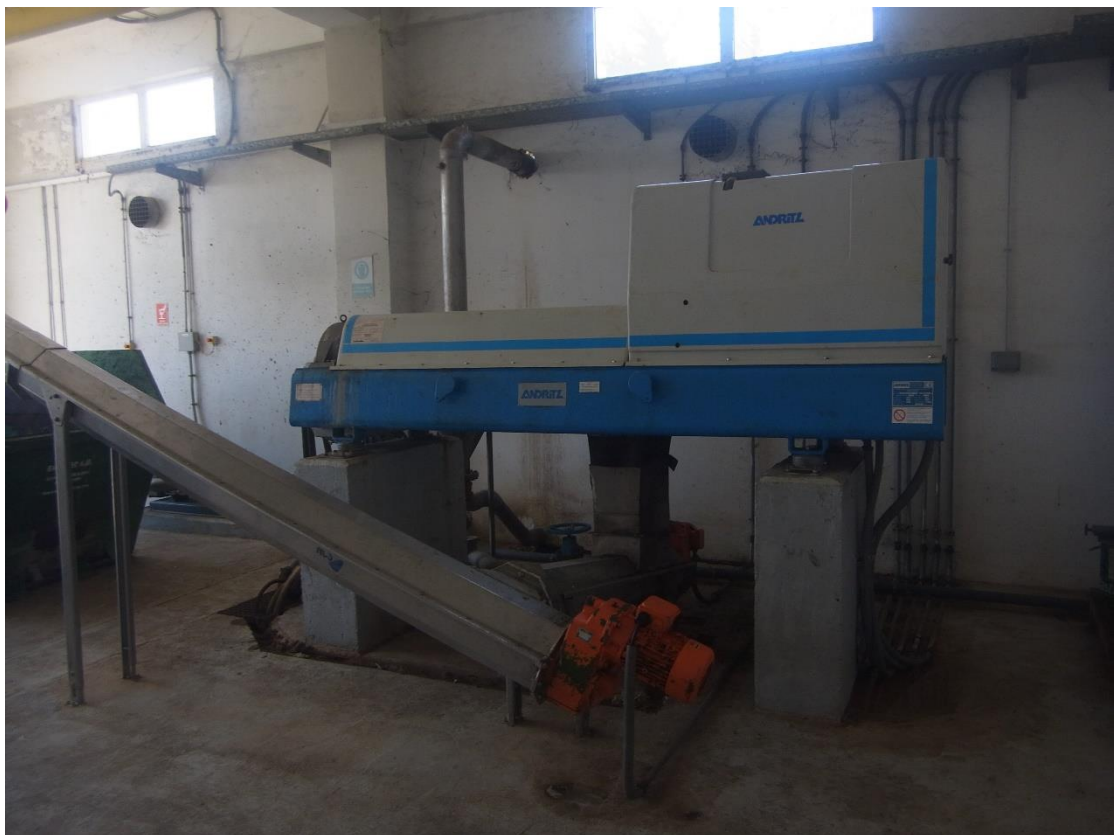
Εικόνα 30: Εγκαταστάσεις επεξεργασίας ιλύος.