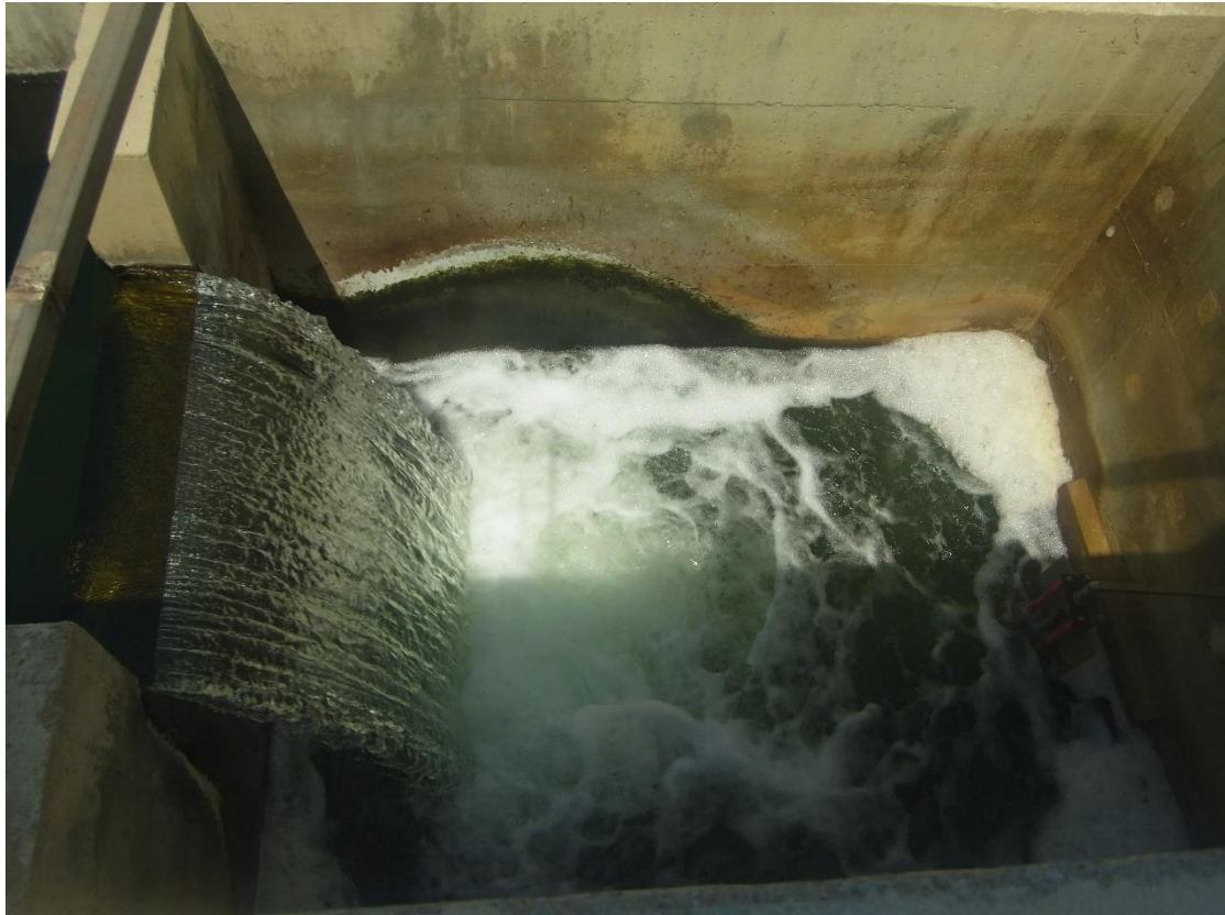
Εικόνα 34: Δεξαμενή Χλωρίωσης.