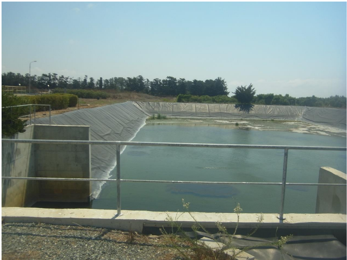
Εικόνα 6: Δεξαμενή έκτακτης ανάγκης