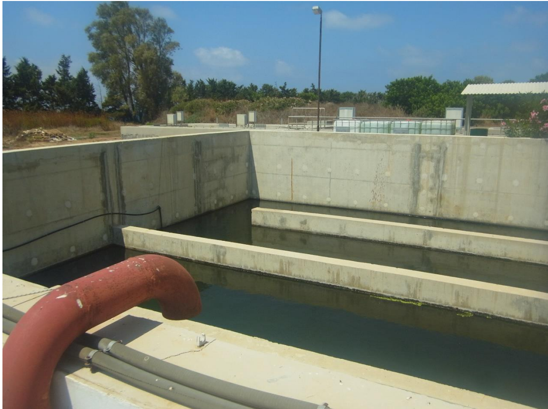
Εικόνα 32: Δεξαμενή Χλωρίωσης.