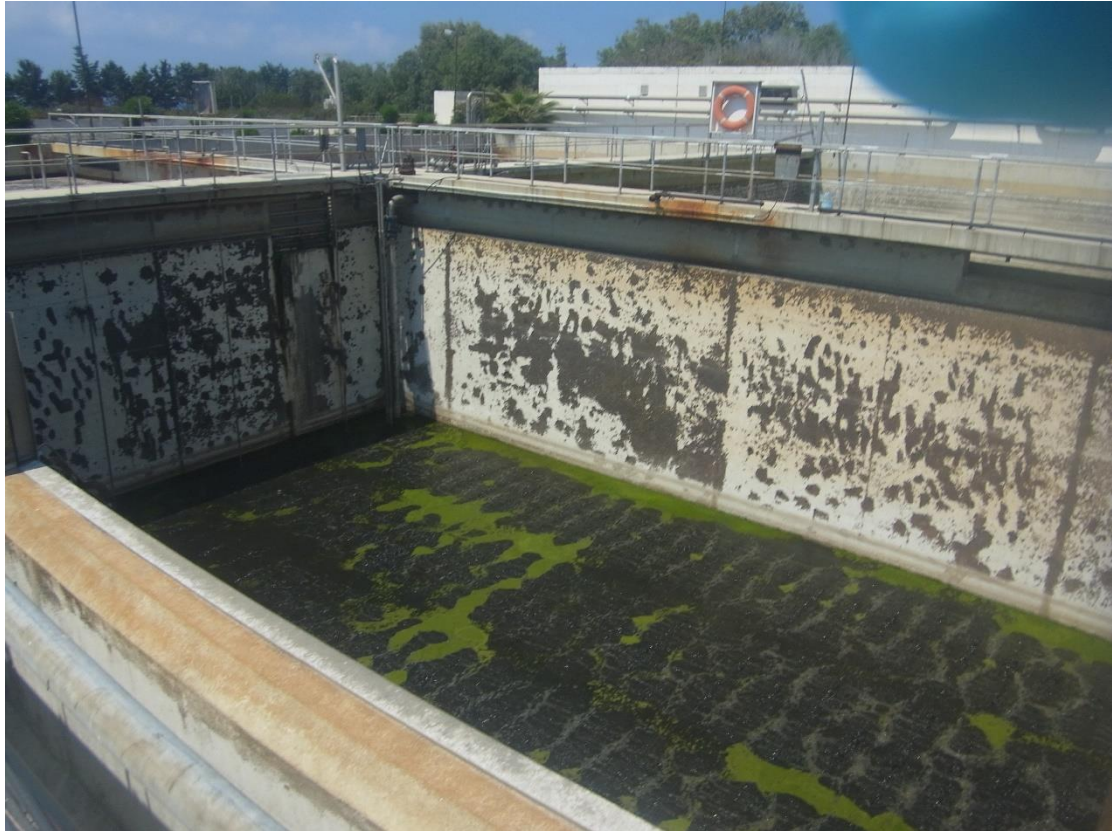
Εικόνα 7: Εγκαταστάσεις βιολογικής επεξεργασίας

Κατά την επεξεργασία της πρώτης φάσης τα απόβλητα εισέρχονται σε δεξαμενές αερισμού με διαχυτές. Η επεξεργασία που λαμβάνει χώρα είναι βιολογική επεξεργασία Ενεργού Ιλύος (Ε.Ι.). Στις Εικόνες 6 έως 18 παρουσιάζονται οι εγκαταστάσεις στην Α' φάσης. Η εγκατάσταση έχει σχεδιαστεί ώστε να καλύπτει μεγάλο εύρος παροχής της εισροής και κατά τις περιόδους που η παροχή δεν είναι μεγάλη, λειτουργούν μόνο οι απαιτούμενες δεξαμενές.