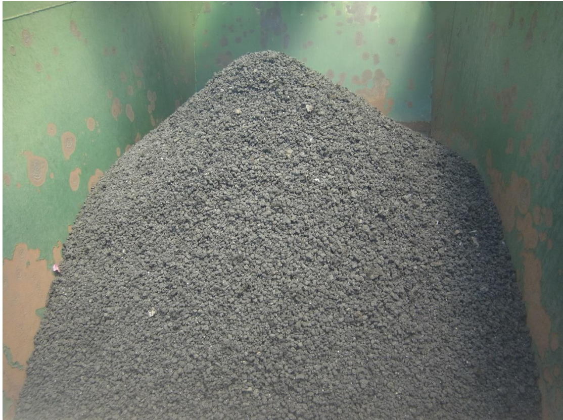
Εικόνα 29: Εγκαταστάσεις επεξεργασίας ιλύος.