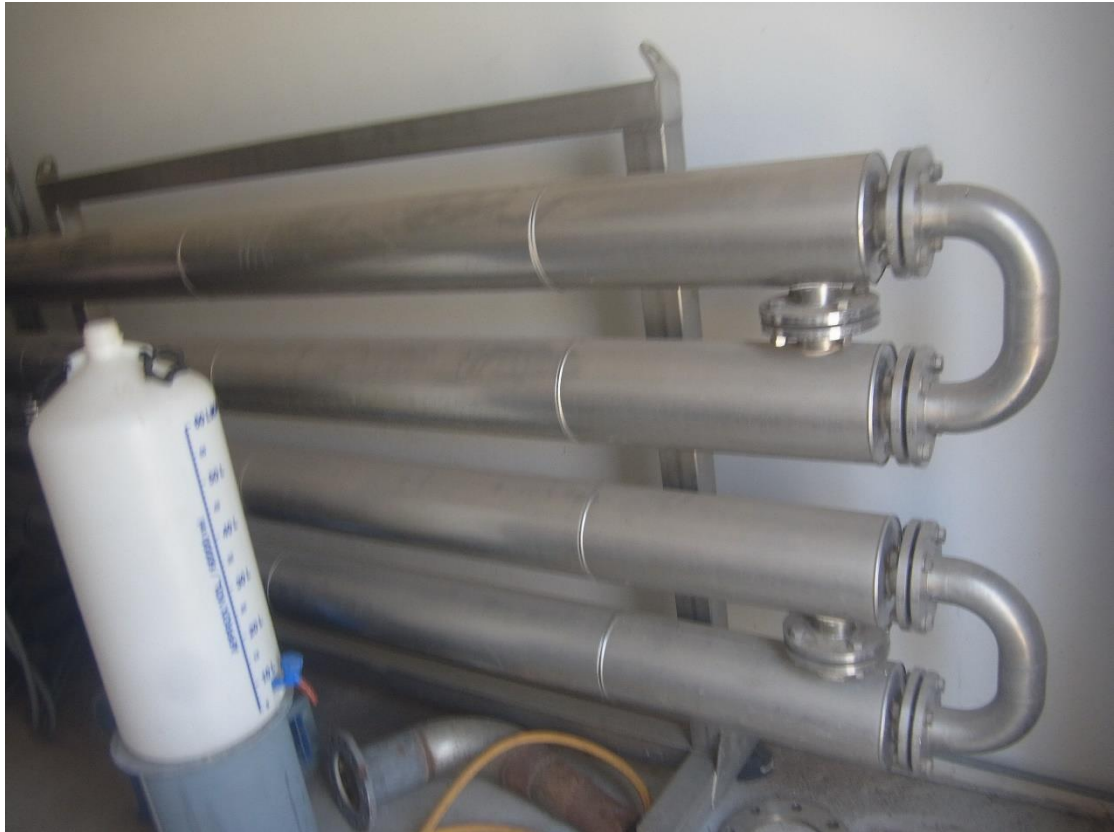
Εικόνα 21: Εγκαταστάσεις επεξεργασίας ιλύος.