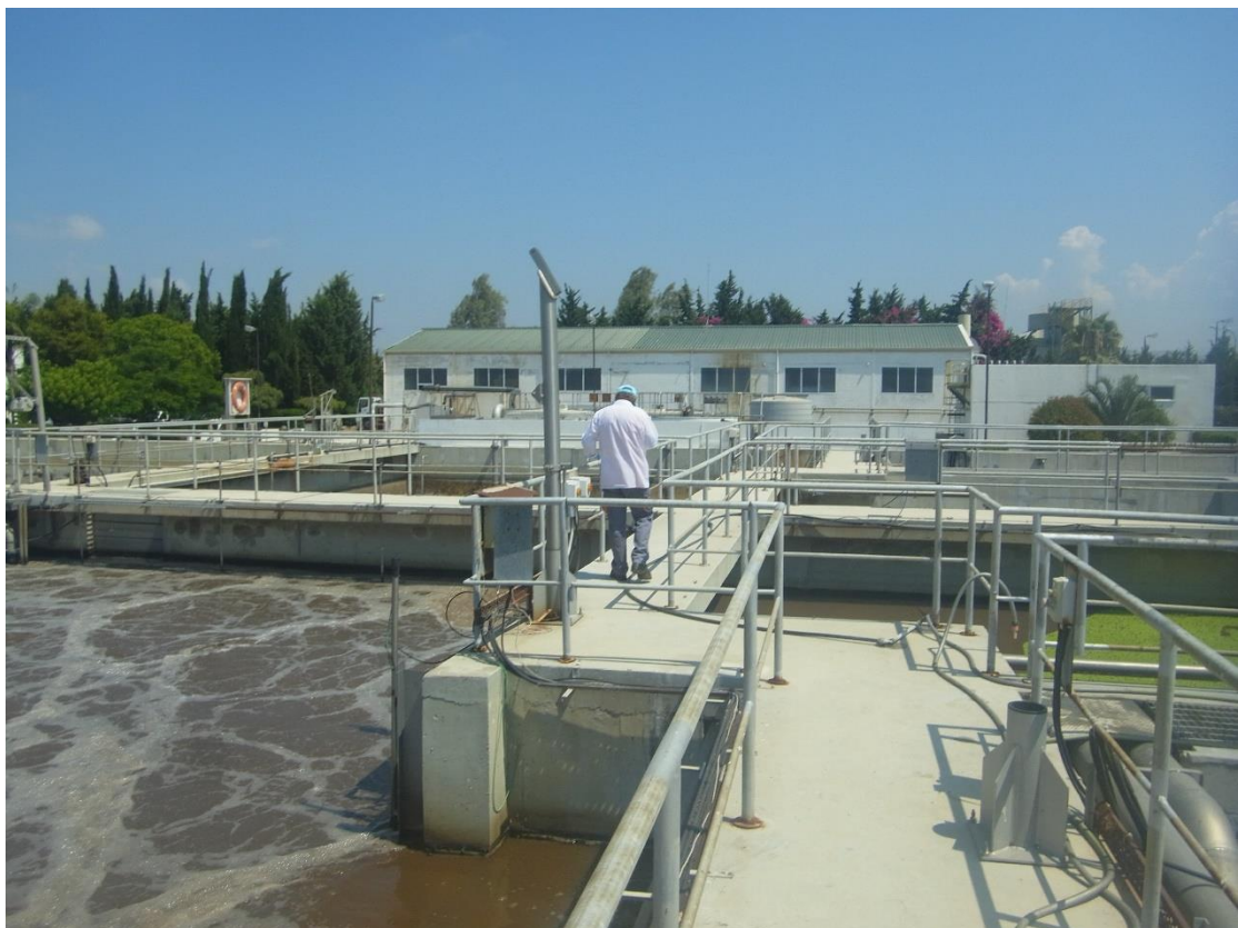
Εικόνα 17: Εγκαταστάσεις βιολογικής επεξεργασίας