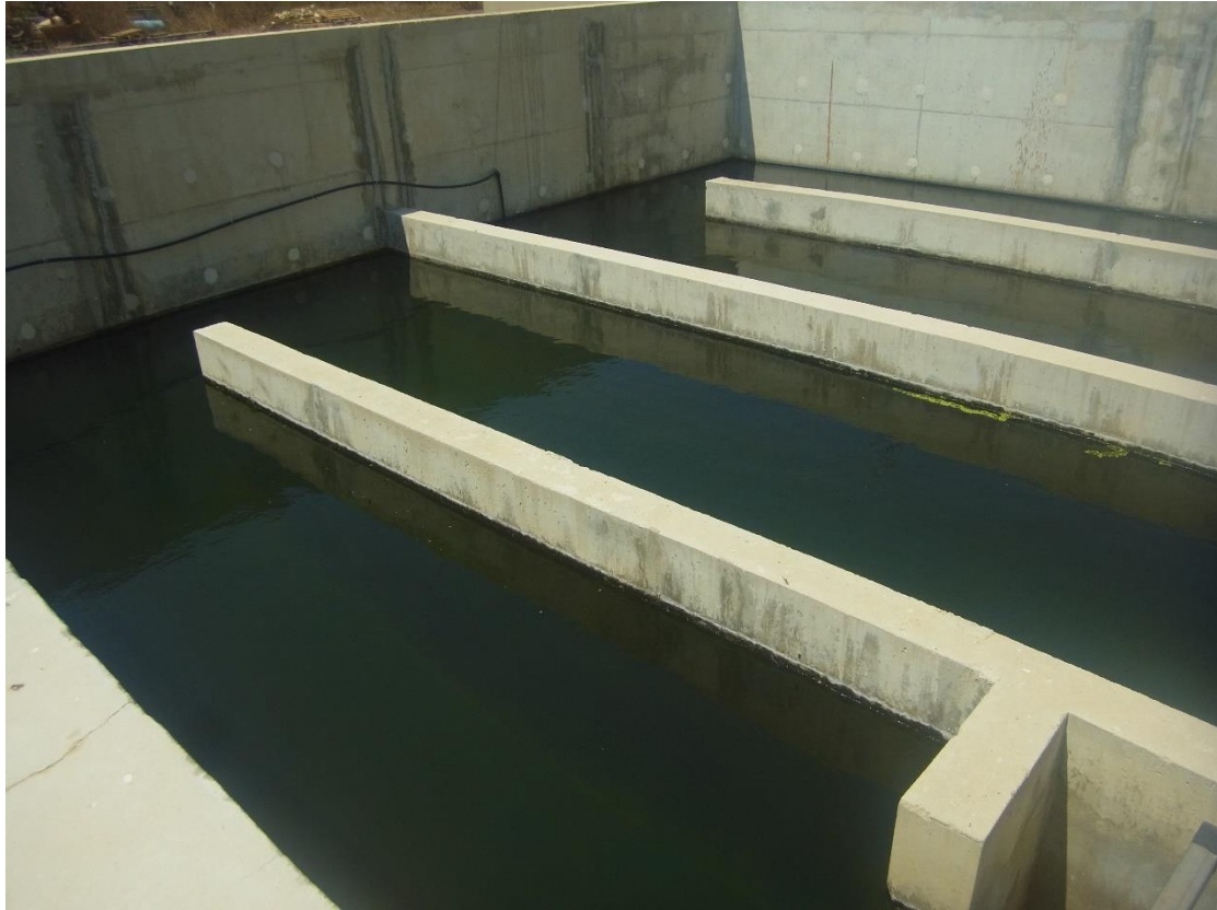
Εικόνα 31: Δεξαμενή Χλωρίωσης

Για την αφαίρεση των παθογόνων μικροοργανισμών ώστε η εκροή να μην εγκυμονεί κινδύνους για την δημόσια υγεία, και να μπορεί να επαναχρησιμοποιηθεί σύμφωνα με τις αρχές της κυκλικής οικονομίας στην Μ.Ε.Α.Υ.Α. Πάφου εφαρμόζεται χλωρίωση πριν την εκροή. Η μονάδα χλωρίωσης είναι μαιανδρικού τύπου όπως παρουσιάζεται και στις Εικόνες 30 έως 33.