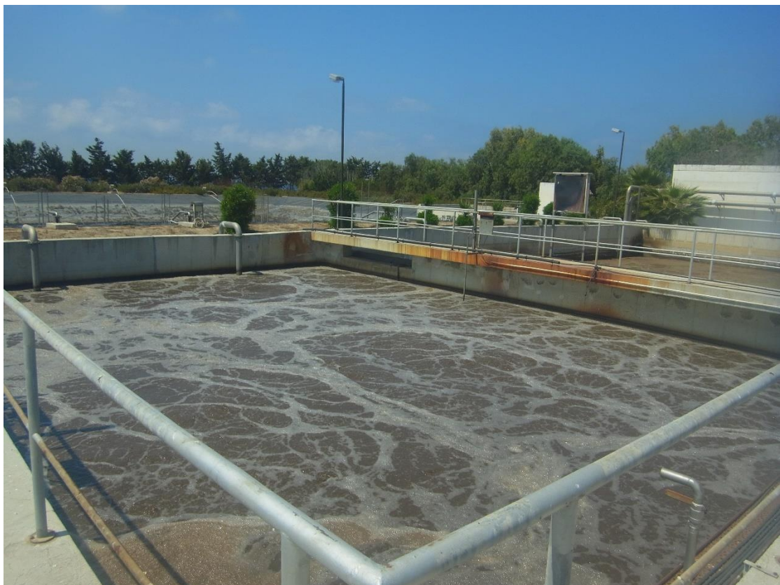
Εικόνα 11: Εγκαταστάσεις βιολογικής επεξεργασίας