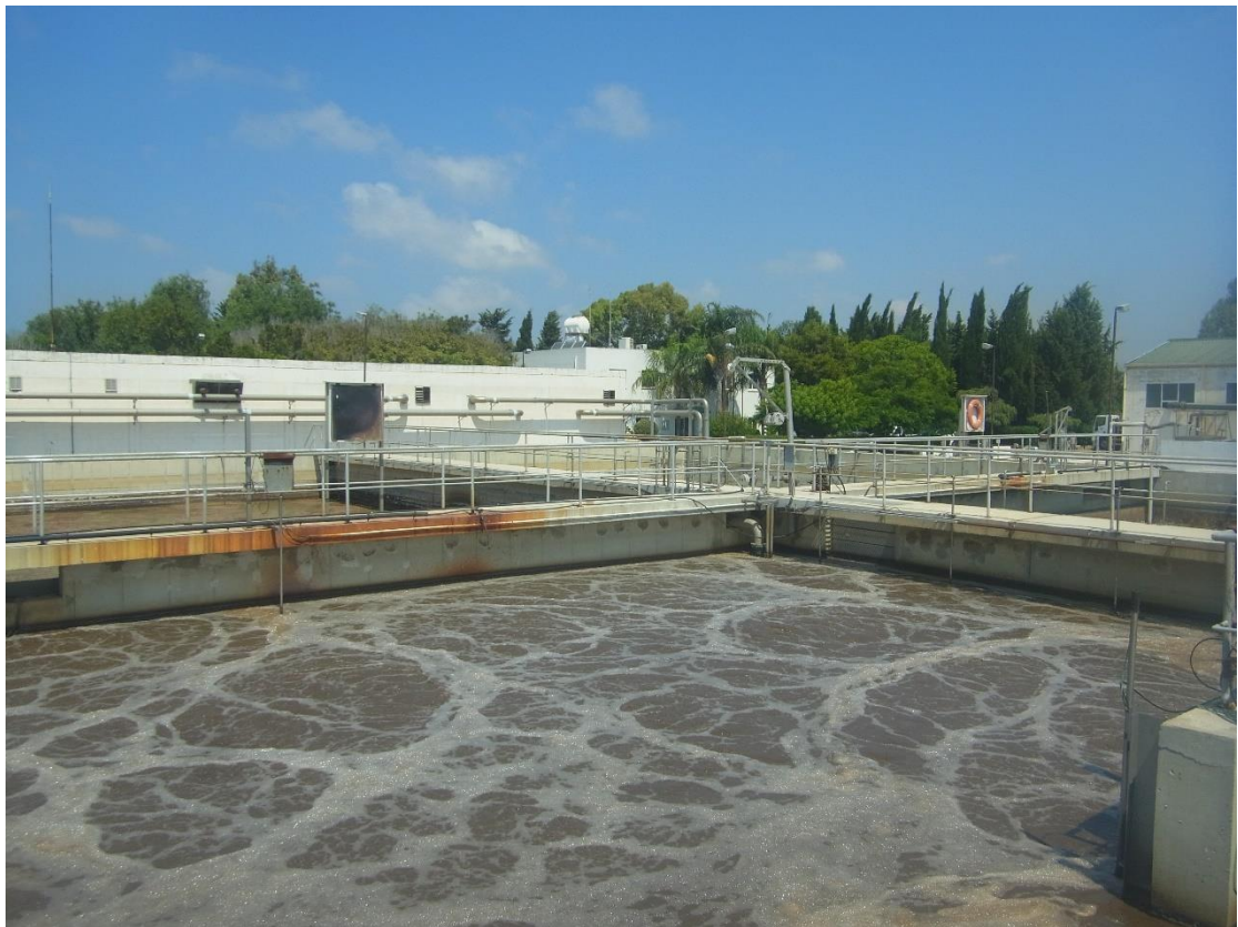
Εικόνα 15: Εγκαταστάσεις βιολογικής επεξεργασίας