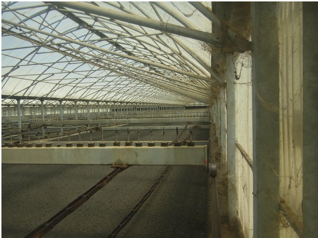
Εικόνα 26: Εγκαταστάσεις επεξεργασίας ιλύος.