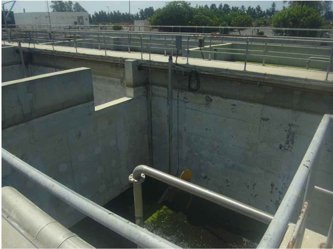
Εικόνα 8: Εγκαταστάσεις βιολογικής επεξεργασίας