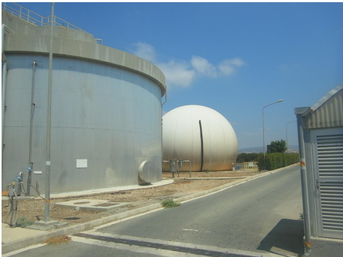
Εικόνα 22: Εγκαταστάσεις επεξεργασίας ιλύος.