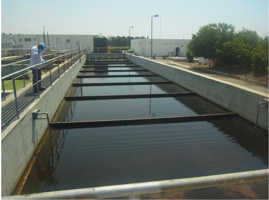
Εικόνα 14: Εγκαταστάσεις βιολογικής επεξεργασίας