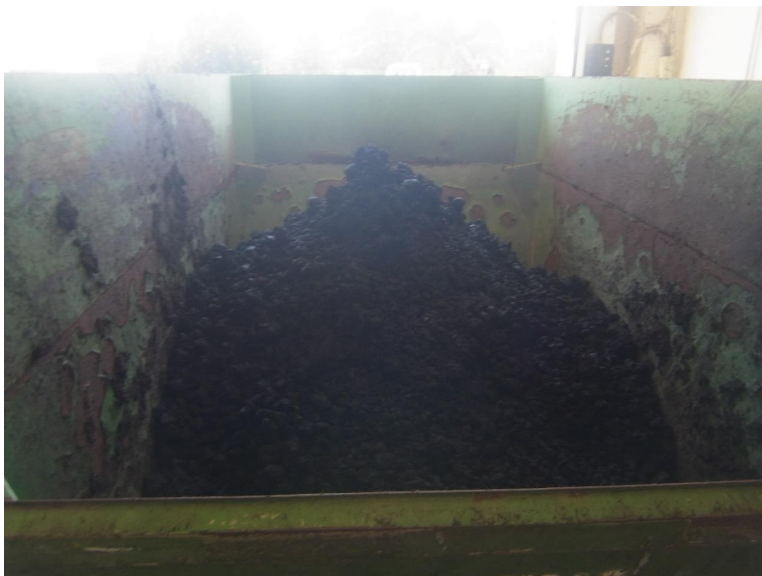
Εικόνα 28: Εγκαταστάσεις επεξεργασίας ιλύος.