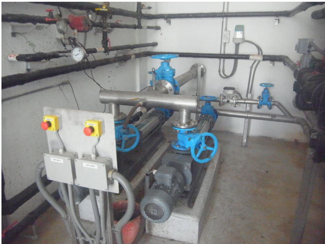
Εικόνα 20: Εγκαταστάσεις επεξεργασίας ιλύος.

Η Μ.Ε.Α.Υ.Α. Πάφου διαθέτει σύστημα αναερόβιας χώνευσης και μονάδα συλλογής του βιοαερίου. Το παραγόμενο μεθάνιο χρησιμοποιείται για την κάλυψη των ενεργειακών αναγκών της εγκατάστασης και όταν δεν επαρκεί η χωρητικότητα πραγματοποιείται εκτόνωση με καύση της περίσσειας. Η παραγόμενη ιλύς από το σύστημα διοχετεύεται για φυγοκέντριση σε decanter, και τμήμα της ιλύος ξηραίνεται και διατίθεται ως εδαφοβελτιωτικό ή οδηγείται σε τσιμεντοβιομηχανία της περιοχής. Στις επόμενες Εικόνες παρουσιάζεται η γραμμή επεξεργασίας της ιλύος.