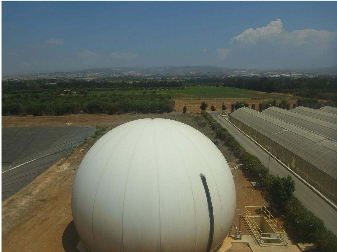
Εικόνα 23: Εγκαταστάσεις επεξεργασίας ιλύος.