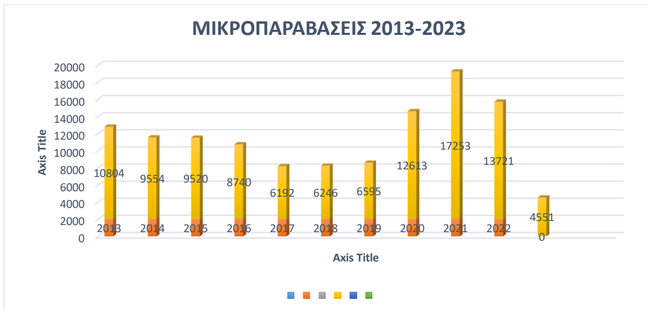
ΓΡΑΦΗΜΑ 2 : Στατιστικά στοιχεία για αριθμό μικροπαραβάσεων από 2013-2023.

Η Αστυνομία της Κύπρου διαθέτει στατιστικές για το έγκλημα στην Κύπρο αλλά δεν έχει στατιστικές για τα αδικήματα που διαπράχθηκαν από αλλοδαπούς η μετανάστες.