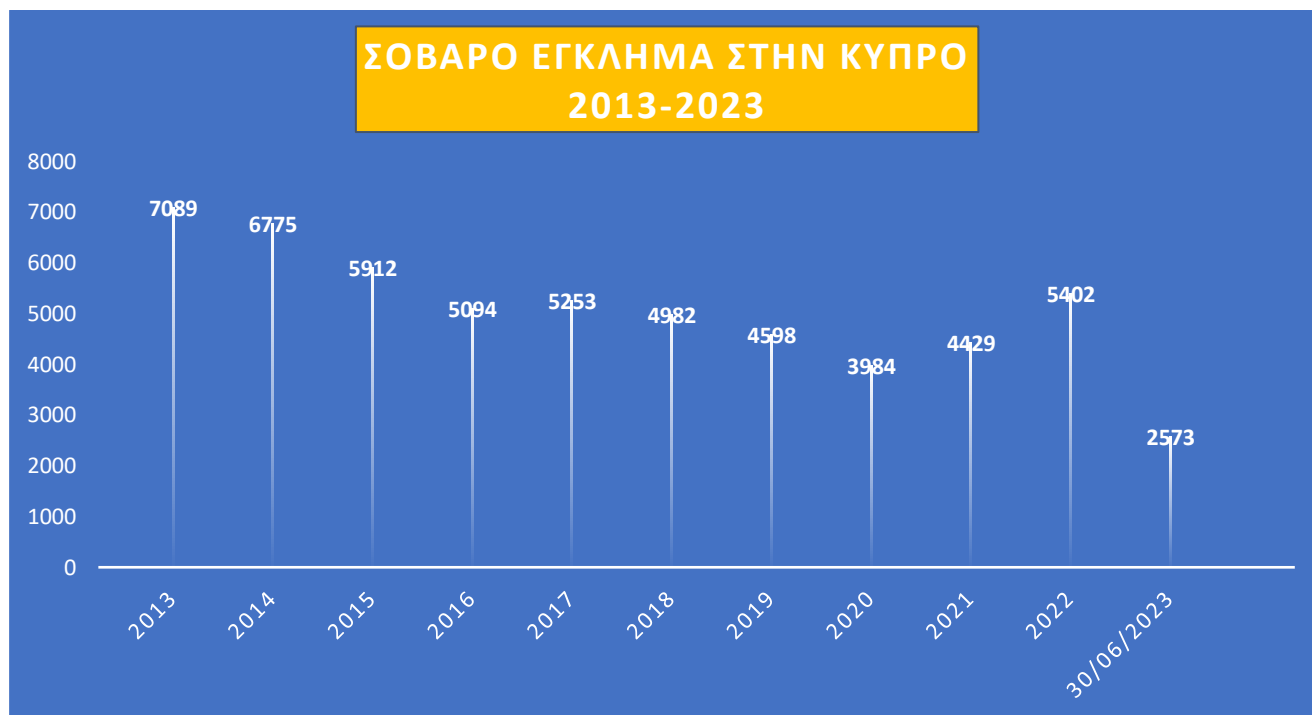
ΓΡΑΦΗΜΑ 3 : Στατιστικά στοιχεία για αριθμό Σοβαρών υποθέσεων από 2013-2023.

Ο πιο πάνω πίνακας παρουσιάζει τις υποθέσεις Σοβαρού εγκλήματος από το 2013 μέχρι τον Ιούνιο του 2023. Στον πίνακα αυτό μπορούμε να δούμε ότι το 2013 υπήρχε ο μεγαλύτερος αριθμός υποθέσεων 7089 ενώ τον επόμενο χρόνο 2014 μειώθηκαν σε 6775. Εάν υποθέσουμε ότι από το 2015 άρχισε μεγαλύτερη εισροή προσφύγων στην Κύπρο και θα αναμέναμε αύξηση του Σοβαρού εγκλήματος αυτό δεν επαληθεύτηκε. Το 2015 το Σοβαρό έγκλημα μειώθηκε ακόμα περισσότερο σε 5912 ενώ τα χρόνια που ακολούθησαν οι υποθέσεις μειώθηκαν και παρέμειναν σε σταθερό επίπεδο. 93