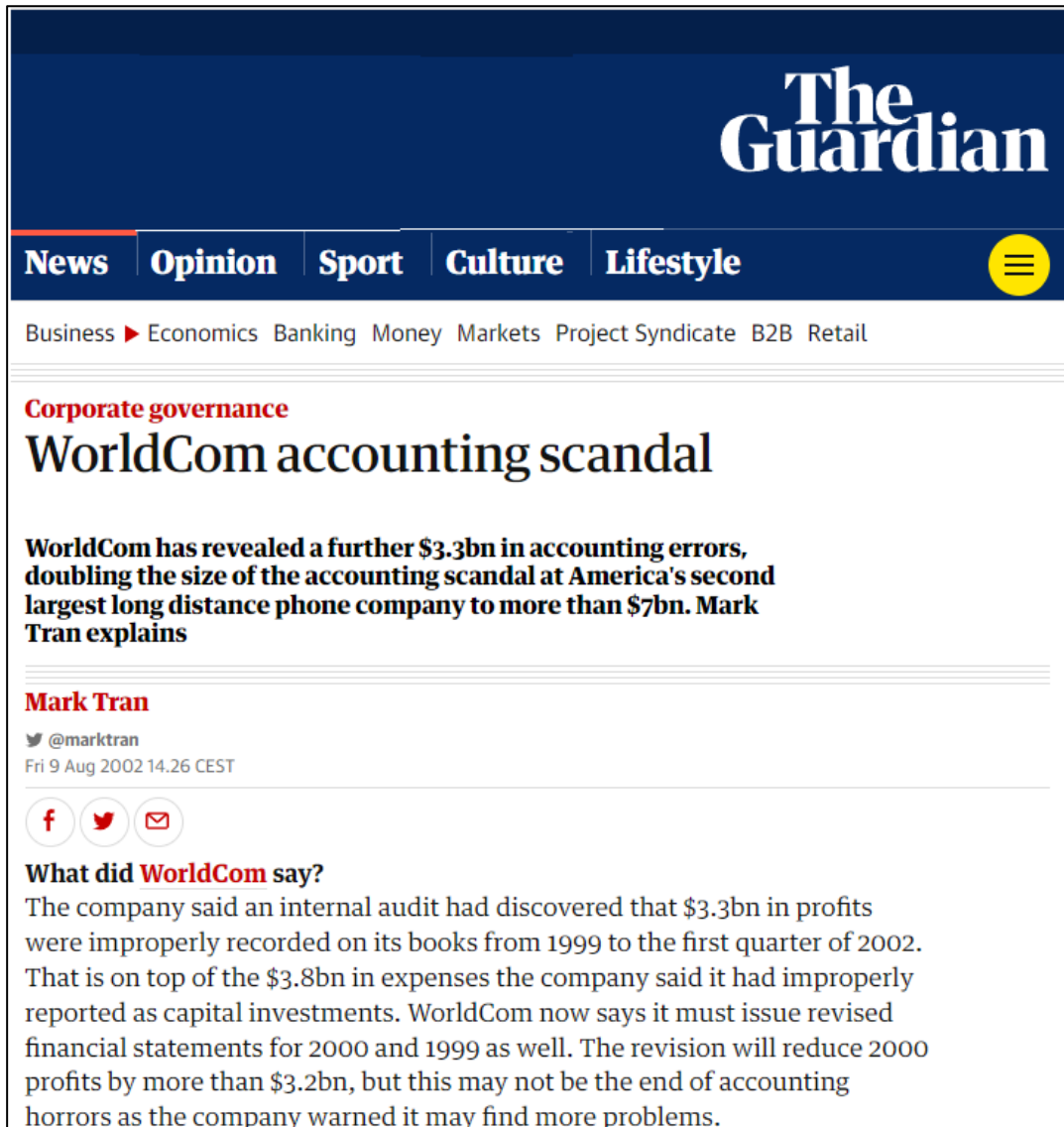
Εικόνα 5.3: Guardian: WorldCom accounting scandal.

https://www.theguardian.com/business/2002/aug/09/corporatefraud.worldcom2