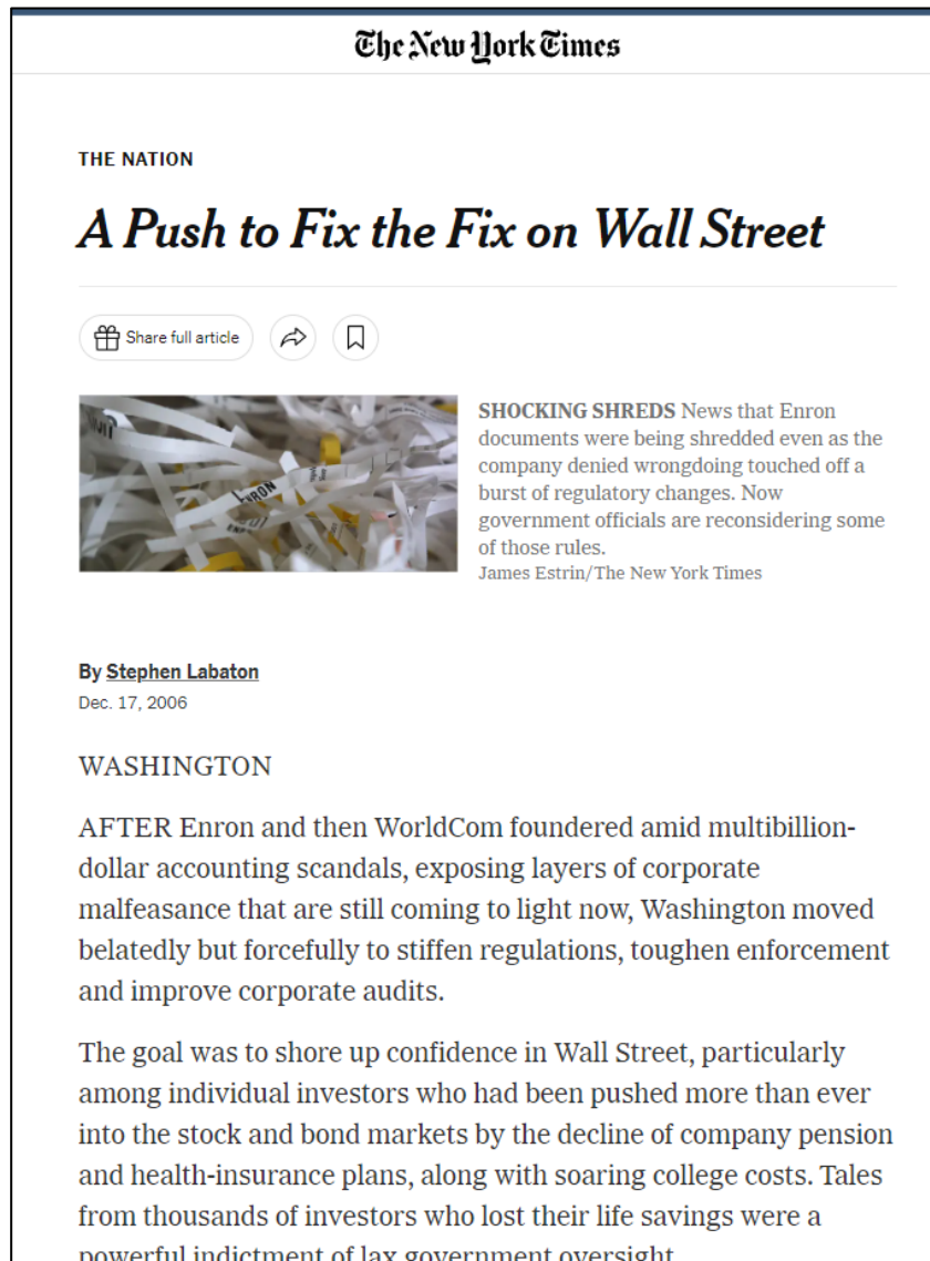
Εικόνα 5.1: NYTimes: A Push to Fix the Fix on Wall Street.