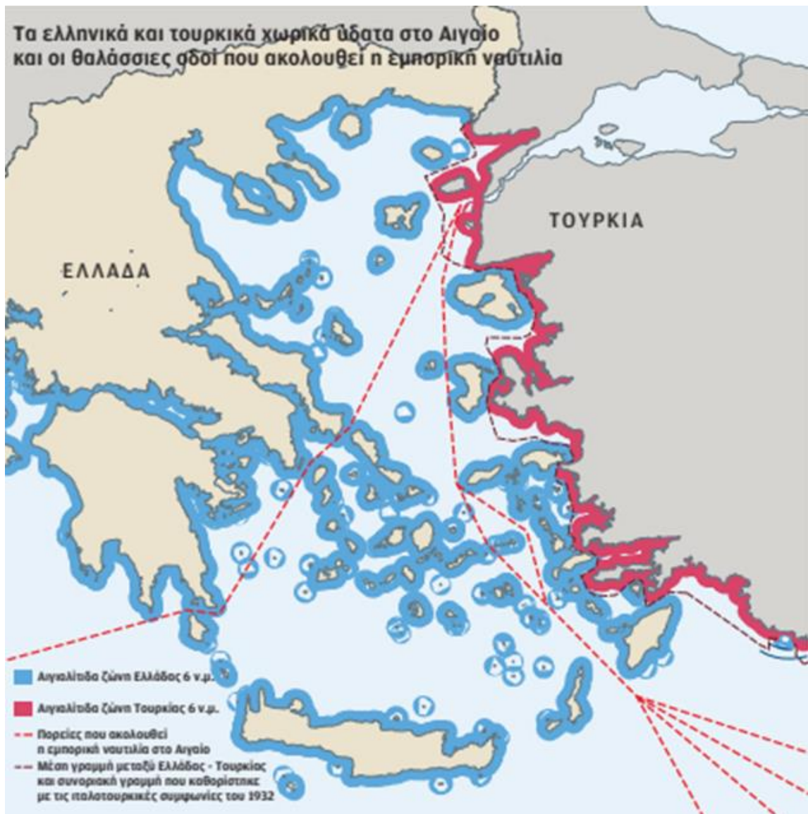
Εικόνα 1: Τα ελληνικά χωρικά ύδατα στο Αιγαίο

Κάτωθι παρατίθεται σχετικός χάρτης όπου διακρίνονται τα ελληνικά και τουρκικά χωρικά ύδατα στο Αιγαίο, καθώς και οι οδοί που ακολουθεί η εμπορική ναυτιλία.