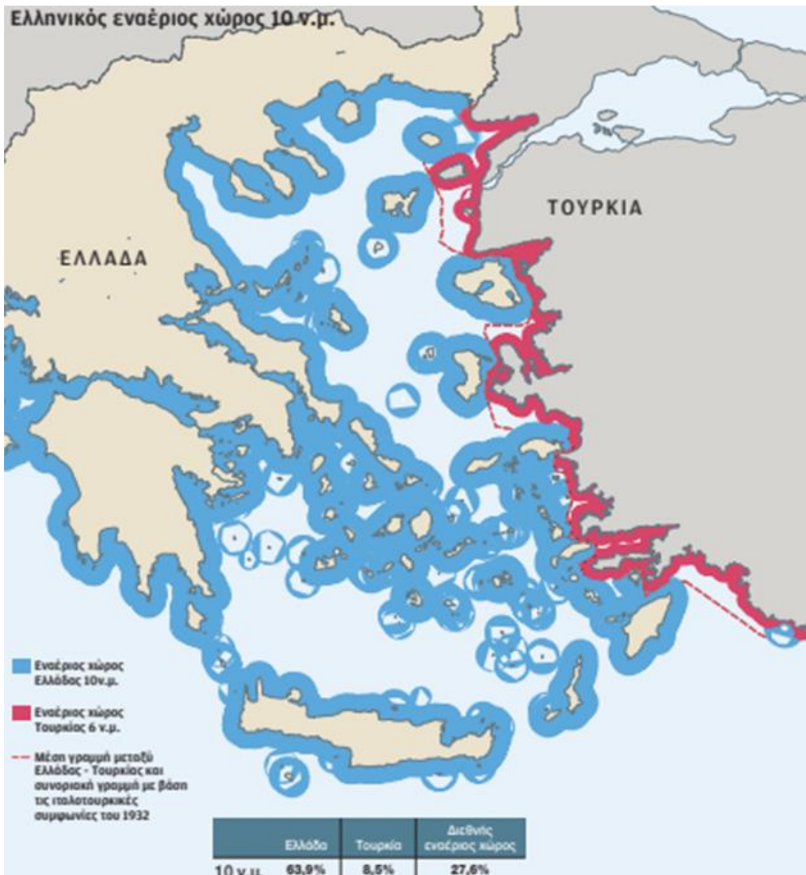
Εικόνα 2: Ελληνικός εναέριος χώρος

Στον ακόλουθο χάρτη διακρίνονται τα δέκα ναυτικά μίλια του ελληνικού εναέριου χώρου.